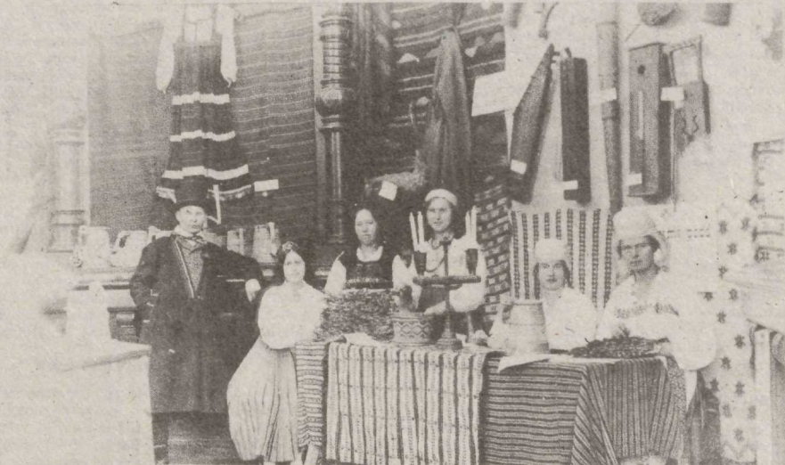
◆ Tallinna Eesti Muuseumis 1922. Seinal nähtavad rahvapillid said tulevase Muusikamuuseumi kogu aluseks.