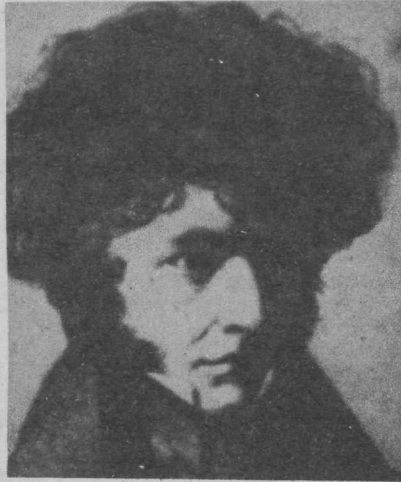
◆ Hector Berlioz

Berlioz romantilist külge võlus baironlik legend. Kuigi see avaldas mõju tema illusoorsele maailmale, oli ta küllaltki ettevaatlik märkimaks, et tema baironlikud teosed ei ole poemidele muusikaliseks illustratsiooniks. Baironliku pealkirja „Le Corsaire“ („Korsaar“) lisis ta oma avamängule pärast seda, kui teos oli täielikult lõpetatud. Kõige tähtsama Byroni teose „Harold in Italy“ („Harold Itaalias“) kohta ütles Berlioz, et tema muusika ei anna poemist mingit ülevaadet. Berlioz võrdustab end Childe Haroldiga kui legendaarse kangelasega ja mõtiskleb oma rännakute üle Itaalias kahekõnes viiulilolisti (kes on ta ise) ja orkestri vahel. Isegi instrumentaalteostes mõtles Berlioz ooperlikult. Selles teoses on edasiarenemise impulsiks viiul, mis on korraga nii täiustuv kui täiuslik. Kujutage ette, kuidas avamängu kirkast ja tihedalt kromaatilistest polüfooniast, milles Christoph Glucki ja tema sümfooniliste ümberkujunduste ning ooperlike traditsioonide vaheline seos on selgelt märgatav, kerkib esile klassikaliselt tasakaalus meloodia. Ja kaks kesket tempot muutuvad silmnähtavalt teisteks võimalikeks läbielamisviisideks. Teine tempo kirjeldab usuolu, mida väljendab modaalne