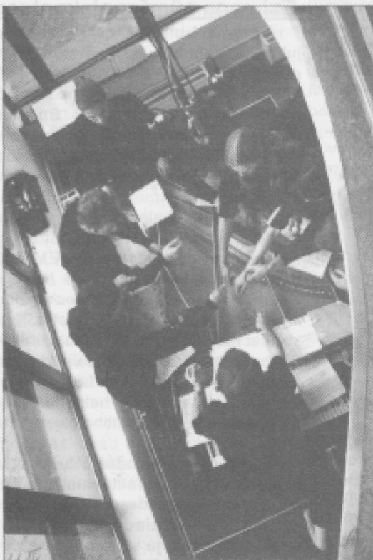
Ülaltvaade poogenklaveri ansamblile

Niisiis tuli kuulajate ette taas kord vanameistri J. Räätsa Kammerorkestri kontsert, aga hoopis M. Keremi keelpillikvarteti esituses ja see oli suurepärane. Vähem sai nõustuda Poogenklaveri Ansambli töötusega Pärdi "Fratres'ist". Teose suurteks väärtusteks olevad rahu, ülim selgus ja lihtsus, hoolikas suhtumine igasse helisse läks uues versioonis sageli kaduma: spetsiifiline sagimine ümber