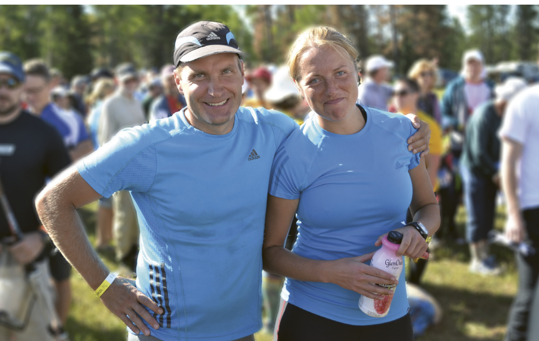
Enne starti. Maastiku ees on tekkinud aukartus, isegi hirm, ja see on ainult hea. Nüüd tuleb üksteist toetada