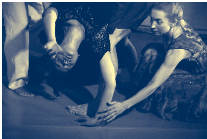
“Enne kui minna, ma ütlen” lisaetendused: 28–30. jaan 2012