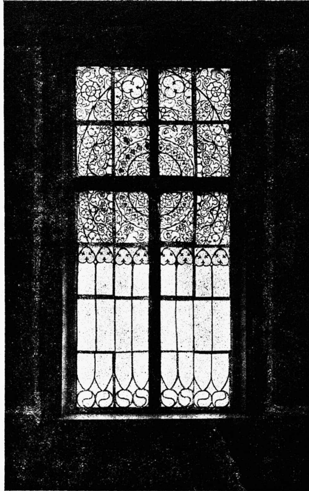
V-da klassi valmistet akende dekoratsioon (transparent) 1930./31. õ.-a. lõppaktuseks.

aastapäevapeo, kaks kinoõhtut ja lugemislaua õpilasile ning annab välja kolm numbrit aja- kirja „Karuohakas“ umbes 150 eksemplaris, esimene number kirjutusmasinal paljundet,