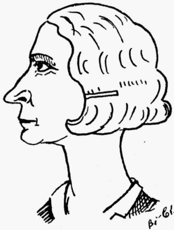
„Nüüd teeme ajalugu.“

Viimasel õppekäigul maateaduse alal nägi palju, millest tavalisel inimesel aimugi polnud. Juhtis suurima agarusega me tähelepanu tee