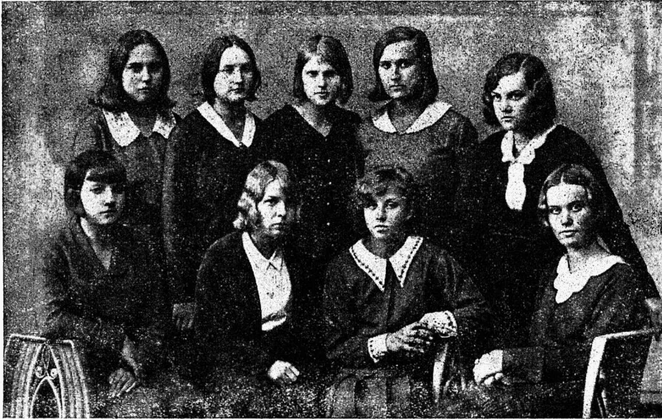
Õpilasingide juhatajad 1931.-32 õppeaastal.

1922./23. õppeaasta kujuneb õpilaste ise- tegevuse alal enneolematult viljakaks. VII ja VIII klasside Vaheline Ring muudetakse Kir- jandus-teaduslikuks Ringiks, kuhu võivad kuu- luda õpilased juba kolmest vanemast kesk- kooli klassist. Kummalgi semestril antakse