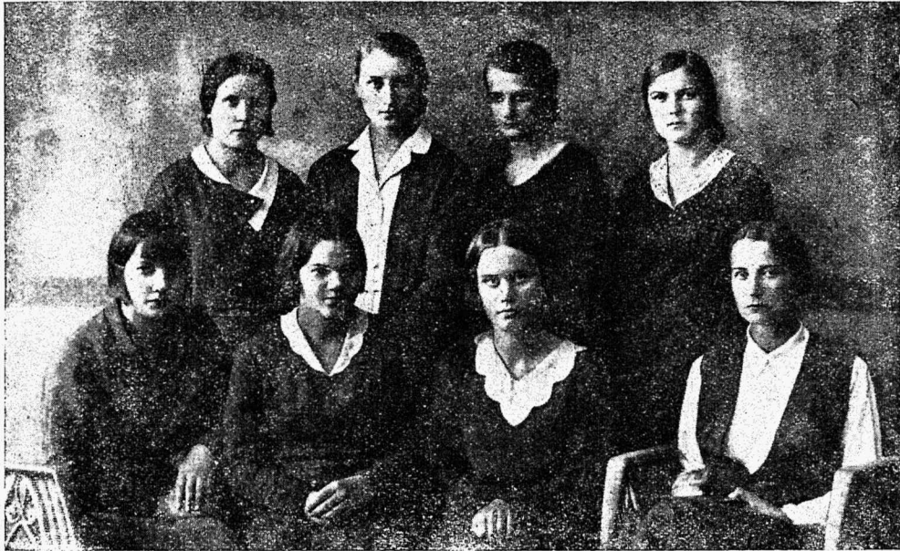
Õpilasühingu juhatus 1931.-32. õppeaastal.