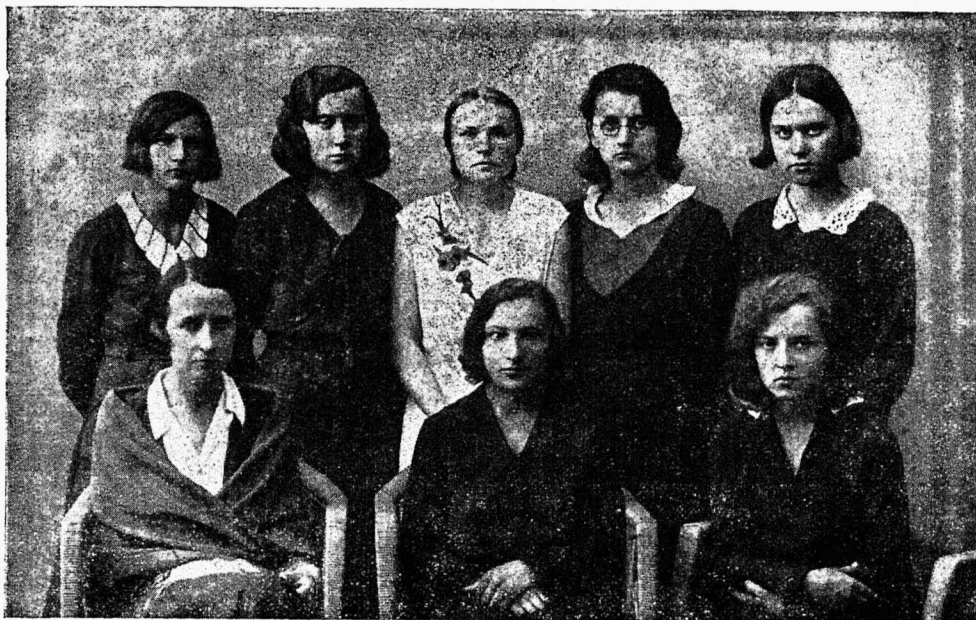
Õpilasingi juhatus 1930.-31. õppeaastal.

loeme ringi asutamiskoosoleku protokollist. Juba samal õppeaastal on kavatsusi Ringi juure luua spordisektsioon, anda välja oma ajakirja jne., tegelikult ei jõuta aga kaugeemale reast referaadi- ja vaidluskoosolekuist, põhikirja väljatöötamisest ning üldisest kohviõhtust. Ring on maksuline ja ta liikmete arv sel aastal umbes 80.