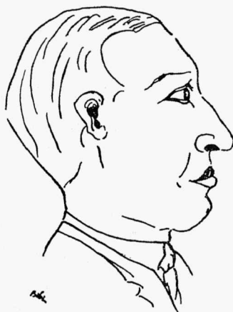
»Kuidas šeda mõišta?«

Sääraste asjaolude mõistmist tahaksime oodata kõigepealt kasvavalt noorsoolt, kes eluküsimustesse suhtub seisukohalt: »nagu peaks olema«. Olgu muuseas tähendatud, et kui E. N. K. S. Tütarl. Gümni õpilaskond seni on 25 a. kestel valdavalt tegutsenud eesti rahvusliku ja riikliku vormilise iseseisvuse