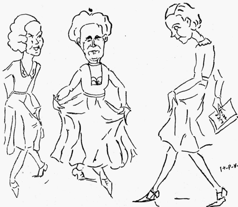
Me direktriissi armsaim ajaviide vahetunnel.

Uute ringidena algavad tegevust: 1) muu-