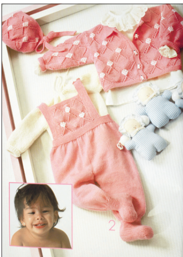
... ja valmis esemed. Pükstele ja kampsunile kulub lõnga 255 grammi, vardad 2,5.

Riiete harutamisel rääkides meenub tahtmatult lugu Tõelisest Armastusest. Kaasajal elanud kord neidis, kelle mehel ihupesu kippus väheks jääma. Võttis siis hoolitsev piiga vähestest pükstest viimased ning harutas need õmblustest lahti. Joonistas nende järgi paberile lõiked, mille järgi omakorda vedas jooned kangale. Ja nii õmbles mitmed paarid valmis, et hiljem hea võtta, liiati ju kangast vabalt käes. Suure õhinaga unustas vaid selle, et ihupesu ka kehale sõbralikust