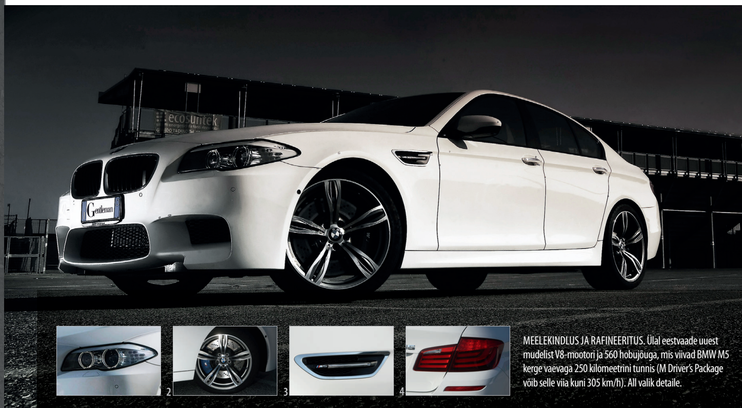
MEELEKINDLUS JA RAFINEERITUS. Ülal eestvaade uuest mudelist V8-mootori ja 560 hobujõuga, mis viivad BMW M5 kerge vaevaga 250 kilomeetri tunnis (M Driver's Package võib selle viia kuni 305 km/h). All valik detaile.

entusiasmi, pädevuse, stiili ja meelegindluse, mis seda Briti kaubamärgi ümbritseb, proovides jõuda Lotuse legendi tuumani. Ehk aitab see aimu saada, milline edasiviiv jõud Chapmani kannustas ning Lotusele senini hoogu juurde annab.