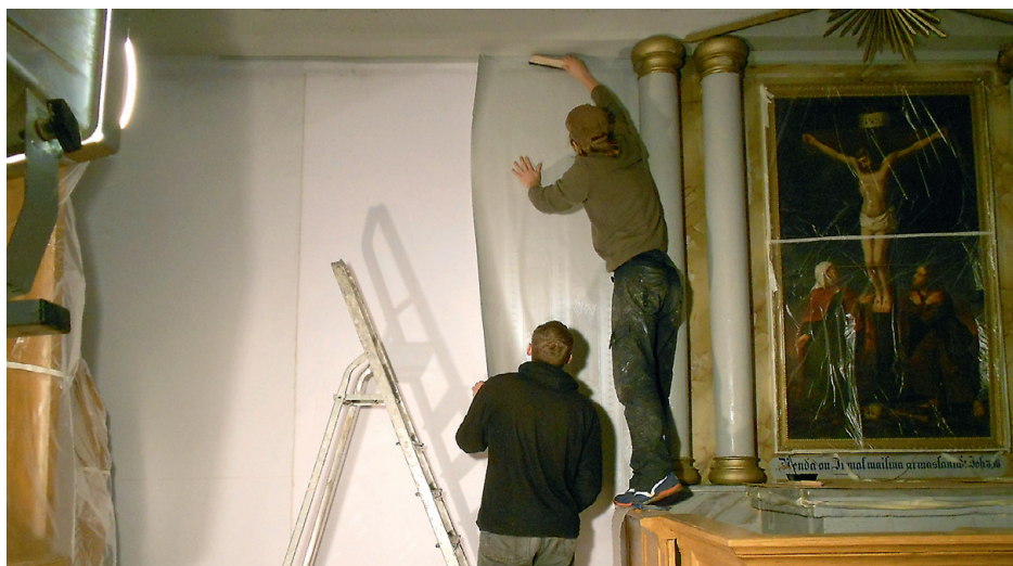
Esimeste käsitsi trükitud tapeedipaanide paigaldamine seinale.

Kabeli tagaseinas saab huviline lähemalt uurida kõiki vanu kihistusi – seal on need välja puhastatud ja konserveeritud.