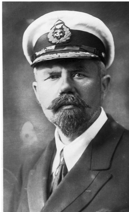
Vabadussõjaaegne merejõudude juhataja Johan Pitka 1920. aastatel.

Balti laevastik oli Eesti vallutamise operatsiooniks allutatud Nõukogude Vene 7. armeele. 13 Laevastikul oli Narva langemisel tähtis osa: kohe sõja esimesel päeval tehti dessant Narva-Jõesuhu, mille tulemusena linn vallutati. Nõukogude Vene Balti laevastik oli hiigelorganisatsioon, üks maailma suuremaid. Laevastikku kuulus 1917. aasta algul, enne revolutsioone umbes 100 000 meest 700 laevaga. Sõja ja revolutsioonide keerises olid laevastik ning ohvitserkond kõvasti kannatada saanud, koosnedes 1918. aasta lõpuks ligemale 25 000 mehest, 14 mistõttu paljudel laevadel puudus meeskond. Olemasolevatest moodustati Balti laevastiku tegev-salk, kuhu kuulus kokku 19 sõjalaeva. 15 Eesti kahelaevaline merevägi ei oleks avamerel suutnud Balti laevastikule mingit konkurentsi pakkuda.