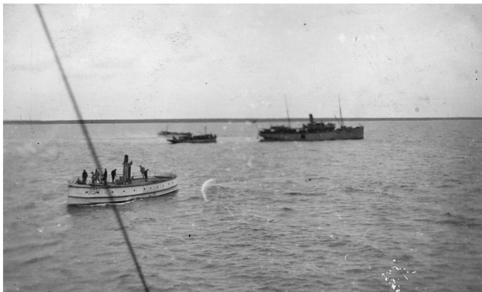
Kalevipojalt traaleritega dessantnike maabumine Luuga lahes 1919. a mais.

15. mai hommikul jõudsid Narva lahte vahilaev Laene (peal Wambola dessantkomando), Kalevipoeg ja Rasson ning koos Lembitu ja traaleritega asuti Luuga lahe poole teele. Kohe teatas Pitka Laidonerile, et laevastik on kohal ja alustab dessandiga. 93 Laidoner pidi sellest omakorda teavitama 1. diviisi ülemat, kel samuti tuli pealetungile asuda. Luuga jõe suudmes pandi dessantlased traaleritele ja väiksematele paatidele. Seekord ei antud laevadelt rünnakut ettevalmistavat suurtükiltuld. Binokliga jälgiti ümbrust ja avastati liikuv vaenlane, kes laevade pihta tuld ei avanud. Pitka läks riskile, eeldades, et punaväelaste arvates on tegemist nende enda laevastikuga. 94 Seega viskasid MDP mehed kaldale lähenedes välja köied ja