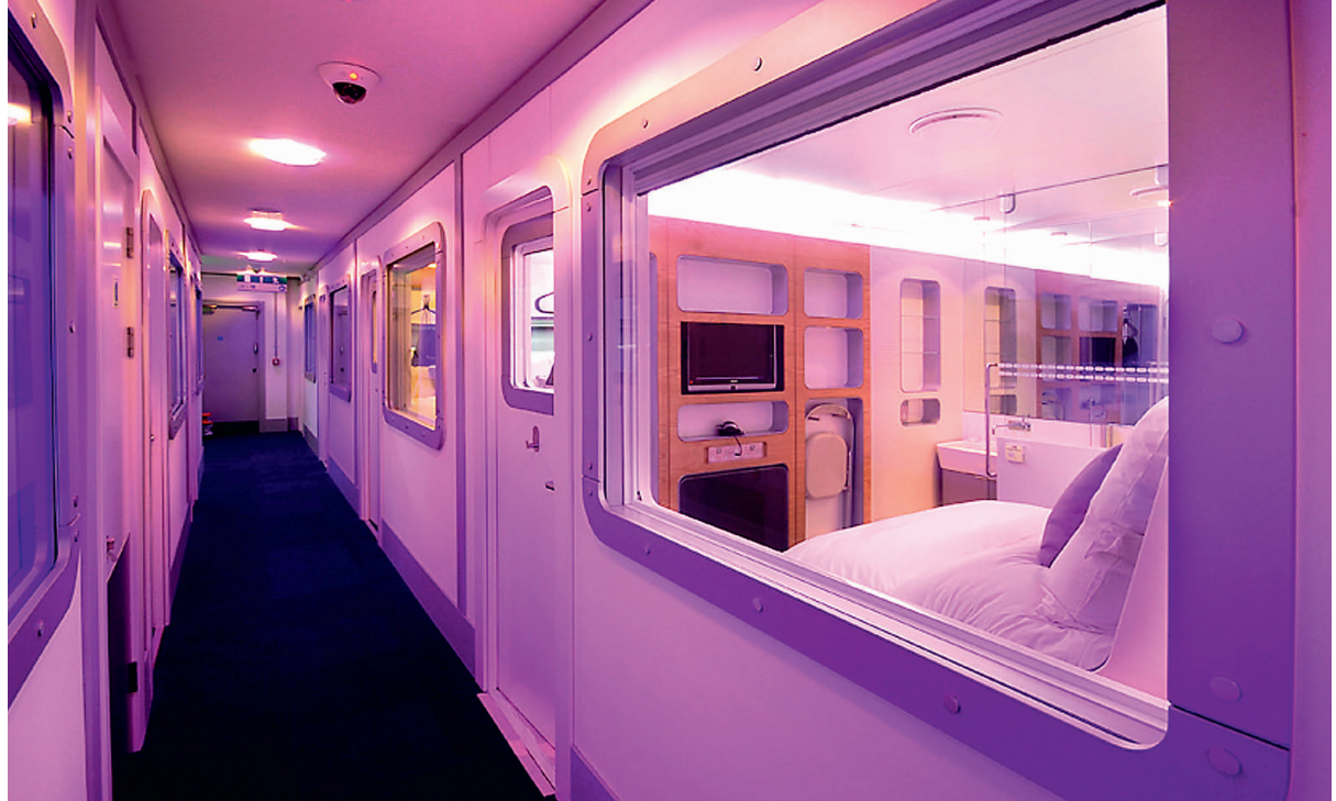
Londoni Heathrow lennujaamas tegutseb Sleepboxi -sarnane minihotell Yotel.