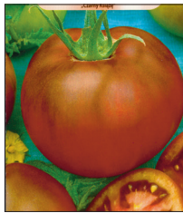
'Noire de Crimée'

Üks parima maitsega sorte "mustade" tomatite hulgas. Pisikesi magusaid mustjaspunaseid "kirsse" on mõnus otse taimelt nagu kompvekke suhu pista. Varane, indeterminantne. Fratelli Grupp.