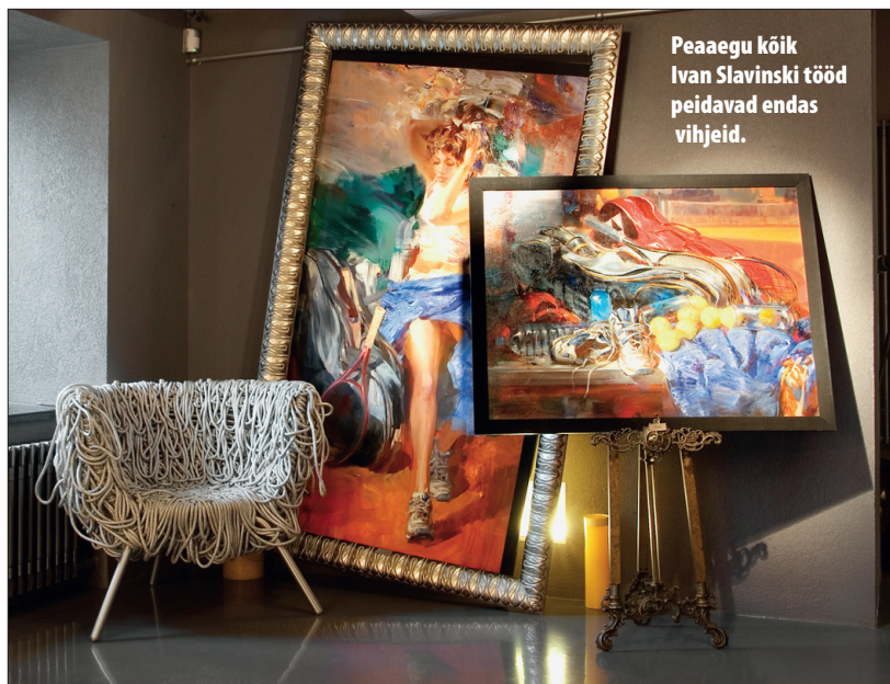
Peaagu kõik Ivan Slavinski tööd peidavad endas vihjeid.