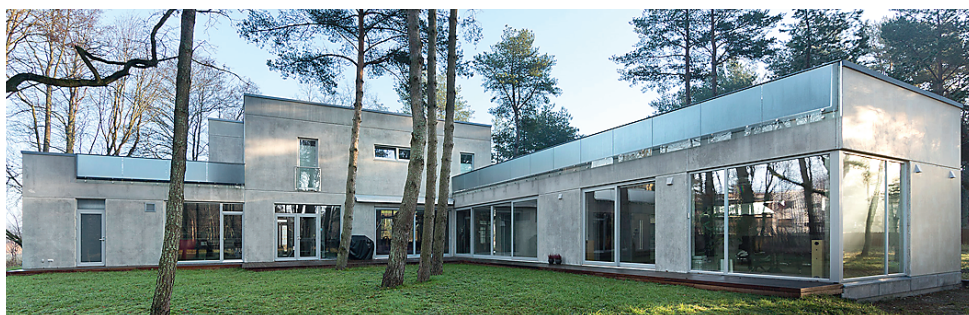
OSAVALT seotud hall ja valge betoon.

Ä Loe veebist WWW.EHITUSUUDISED.EE Aasta betonehitise konkursile esitatud tööd ja kommentaarid