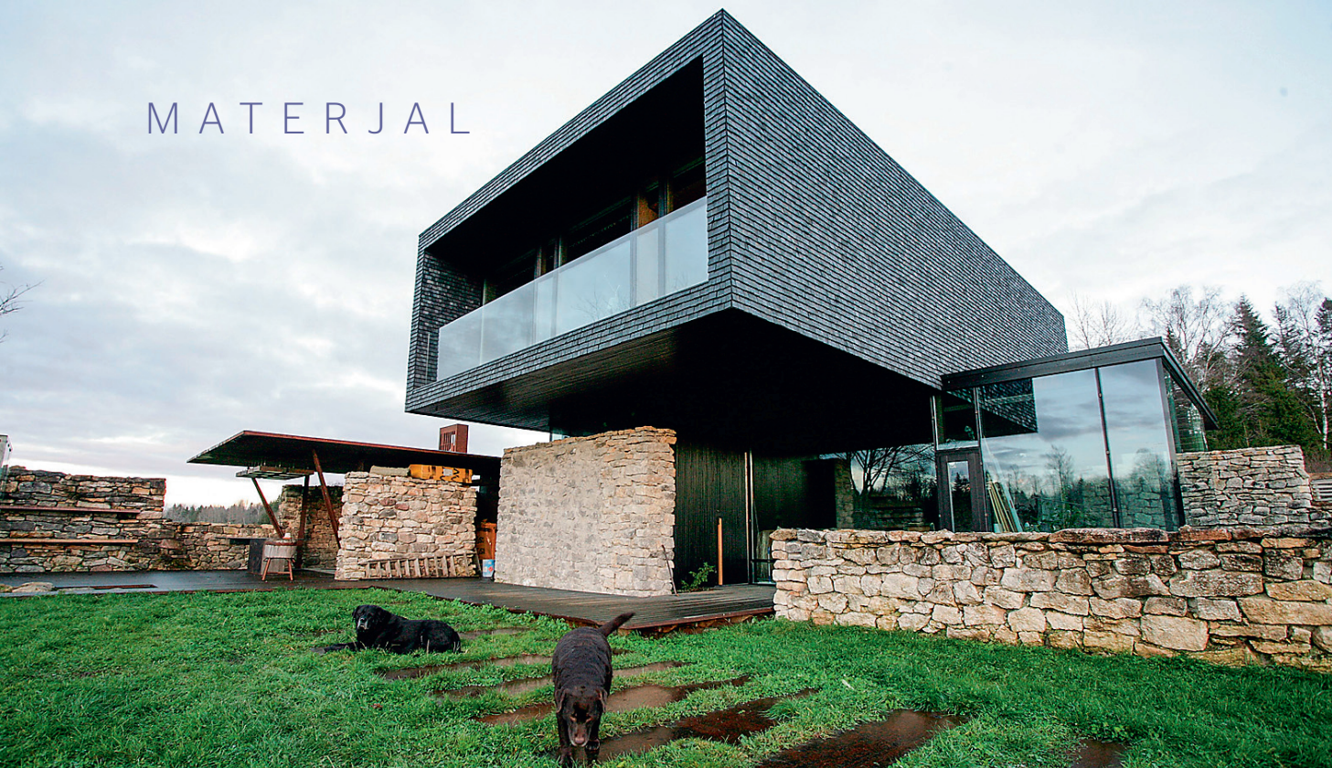
JÄRVA-JAANIS asuva omapärase eramu insenerist omanik julgeb katsetada.