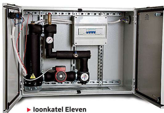
► Ioonkatel Eleven

Ioonkatla võib paigaldada sarnaselt gaasikatlaga kõõgi seinale ega pea seejuures kartma gaasileket. Ka ei vaja katel märkimisväärselt hooldust.