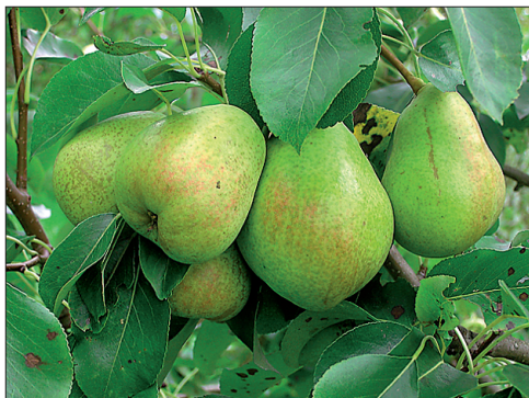
► “Pepi” on nii viljakas sort, et vahel tundub, nagu oleks puus vilju rohkem kui lehti.

ta on osutunud vastupidavamaks kui paljud teised ploomisordid. Eesti ploomidest rääkides tuleb kiita ka “Vilmitari”, mis oma aprikoosi meenutava välimuse ja maitsega on iga aia ja laua ehteks.