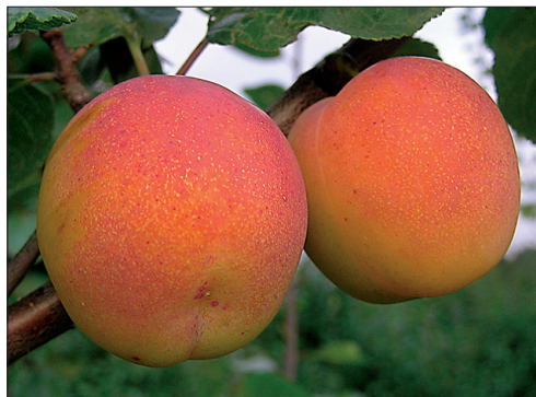
► “Vilmitar” on “Ave” ja “Kadri” kõrval üks maitsvamaid Eesti ploomi-sorte.