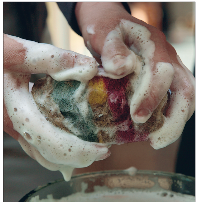
Saunaseebi viltimine käib rohke seebivahu ja veega.