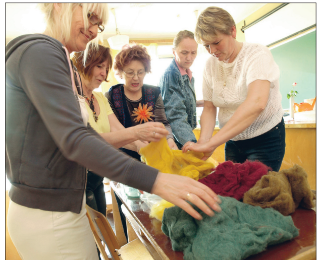
Sonda naised valivad materjali, millest viltida saunaseebi ümbrised.