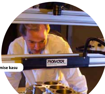
Profactori projekt näitas ELi-poolse rahastamise kasu

” Saksamaa pikaajaline programmide järelevalve kogemus annab kindla aluse praegu jälgitavatele järjest ulatuslikumatele näitajatele. ”