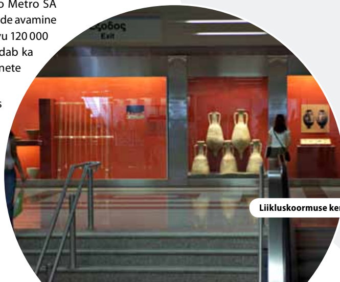
Liikluskoormuse kergendamine Ateenas