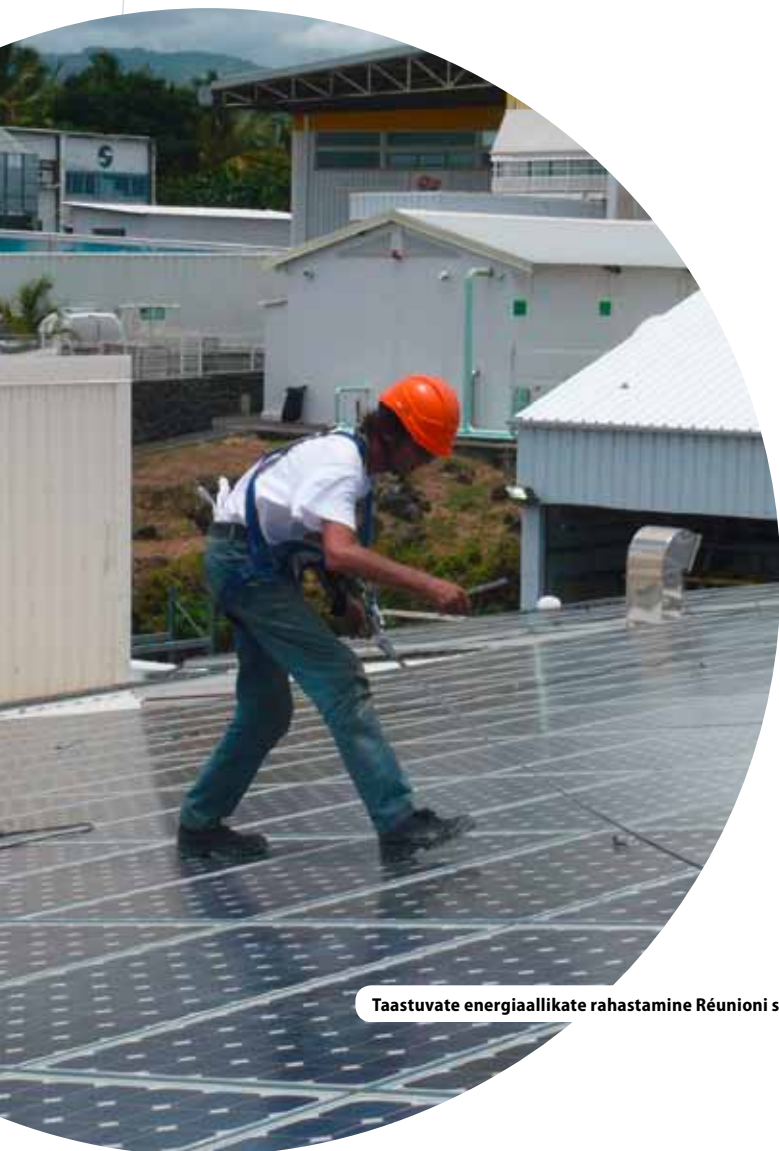
Taastuvate energiaallikate rahastamine Réunioni saarel

” Algselt vaid programmide kontrollimise kohustust kujutanud tegevusest on kujunemas avaliku halduse valdkonnas kaasaegse juhtimise eeskuju. ”