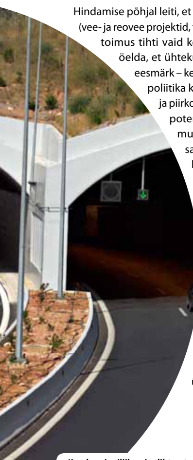
Kreekas ringliikumise lihtsustamine

Osa hindamisest moodustas Ida-Saksamaal toetatud ettevõtete võrdlemine mittetoetatud ettevõtetega. Uuring tõestas, et toetatud ettevõtetel olid paremad tulemused investeerimise, teadus- ja arendustegevuse ning patentitaotluste seisukohast.