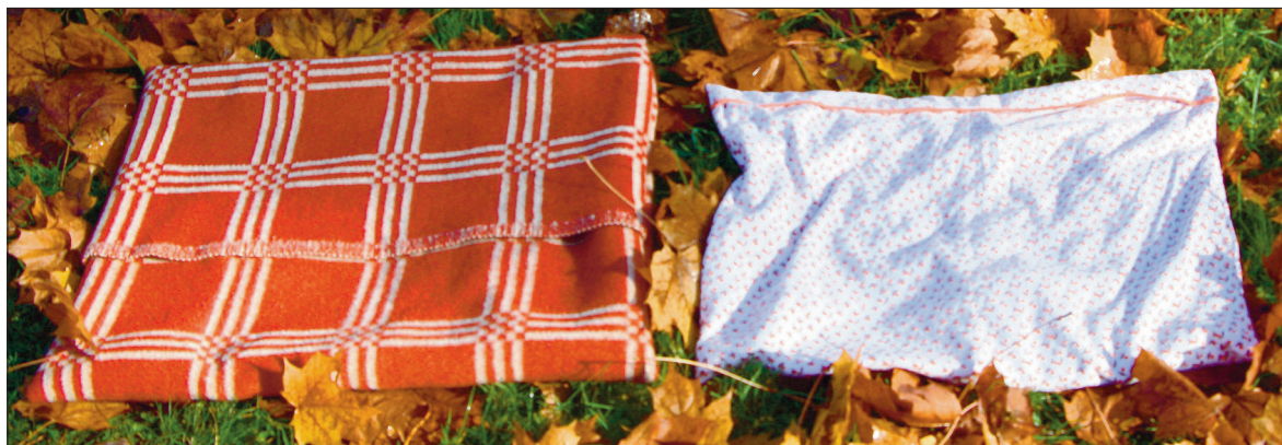
Asetage kastanimunade ja tammetõrudega täidetud vooder välimise ümbrise sisse.