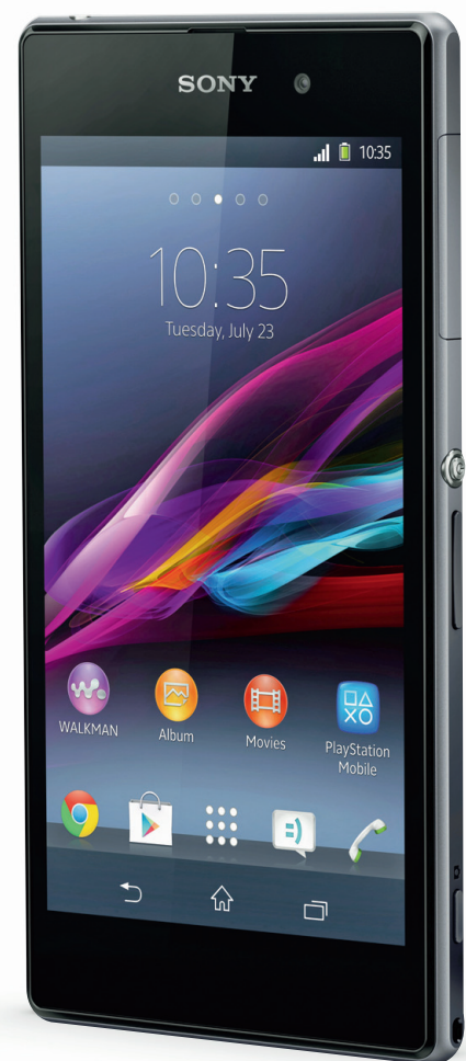
SONY XPERIA Z1 SUPERFOTODE JAOKS

Kõige nende kombinatsioon pakub samal tasemel kvaliteeti ja sooritusvõimsust, mis kompaktdigikaamerad, ent seda kõike õhemas ja veekindlas nutitefonis. Sony on suutnud need omadused ühendada veel rafineeritud ja stiilse disainiga – monokokk-alumiiniumist ning vee-, lume-, liiva- ja kukkumiskindla klaasiga. Tegu on seega suurepärase protsessoriga nuti-