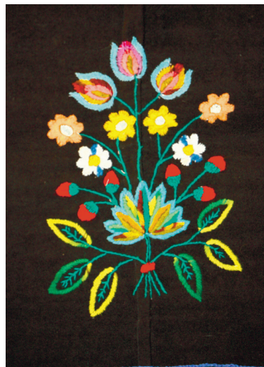
Näituse rariteetideks võib pidada kaht mustale põhjale tikitud tekki, mille kangaks on Pakri saarte naiste seelikute lahtiharutatud laiud koos mõnes servas säilinud alupärase üllilihtsa tikanditriibuga.