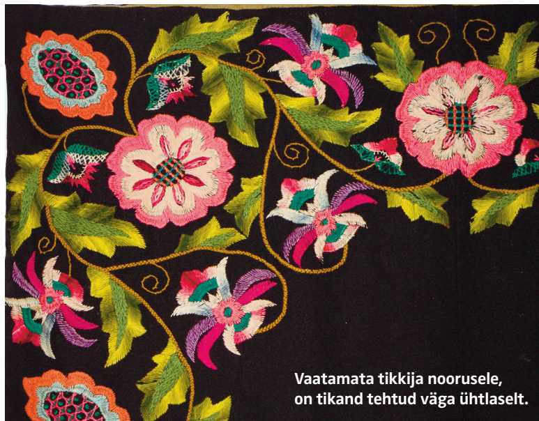
Vaatamata tikkija noorusele, on tikand tehtud väga ühtlaselt.