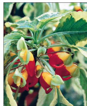
I. niarniamensis 'Variegata'.