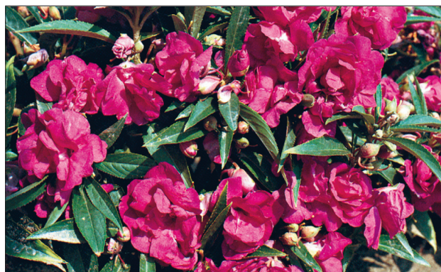
Balsamiin-lemmaltsa sort 'Tom Thumb Purple'.

Sultan-lemmalts, Firefly- ja Seashells-hübriidid on kõik väga head aiataimed. Nad sobivad täispäikeselisele kohale ja ka varju. Puudealustesse kohtadesse valige madalad sordid, kuna väheses valguses venivad nad naguini pikemaks.