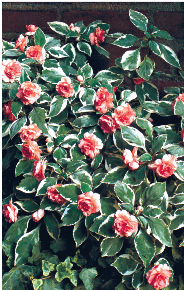
Sultan-lemmaltsa täidisõieline ja kirjulehine sort 'Pink Ice'.

Balsamiin-lemmalts ehk aedbalsamiin ( I. balsamina ) on pärit Kagu-Aasiast. Teda on kerge seemnetega paljundada. Tal on palju sorte, liht- ja täidisõielisi (kõrgus 25–70 cm). Moodsad hübriidid on madalad ja kompaktsed,