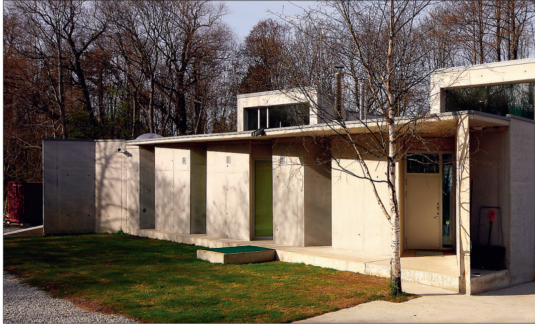
► Maa poole pööratud külg kannab endas ehk enim kunagise militaararhitektuuri vaimu.

Villa Lokaator nimeks saan- nud eramule andis arhitekti- de liidu žürii 2006.–2007. aast- a parima peremaja tiitli just nõukogudeaegse sõjaväearhi- tektuuri varemetesse mood- sa vormi integreerimise eest. Peale selle, et lubatud ehitus- ala jäi täpselt vana baraki pii- resse, soovis tellija ka, et arhi- tektid sellest doonorist veidi