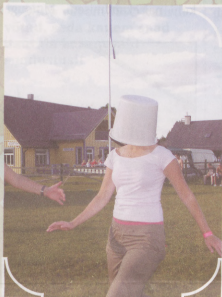
Ebsika viis põgeneda reaalsusest