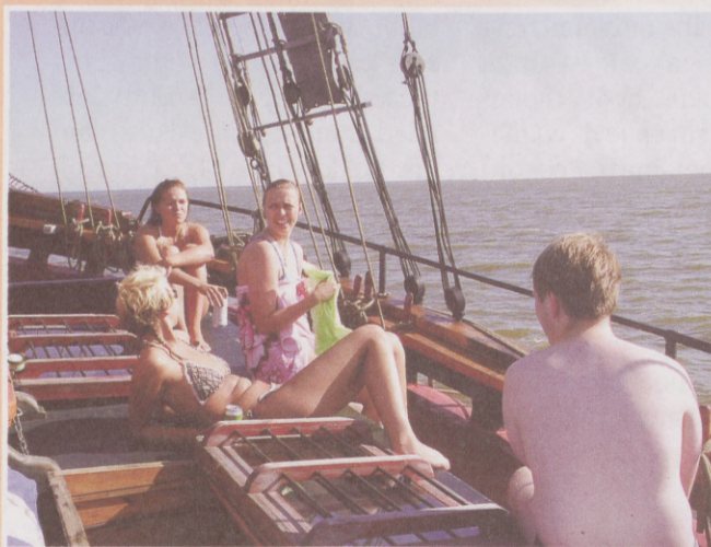
Turgutav suplus meres ja siis peesitamine päikese käes - ülilmõnus