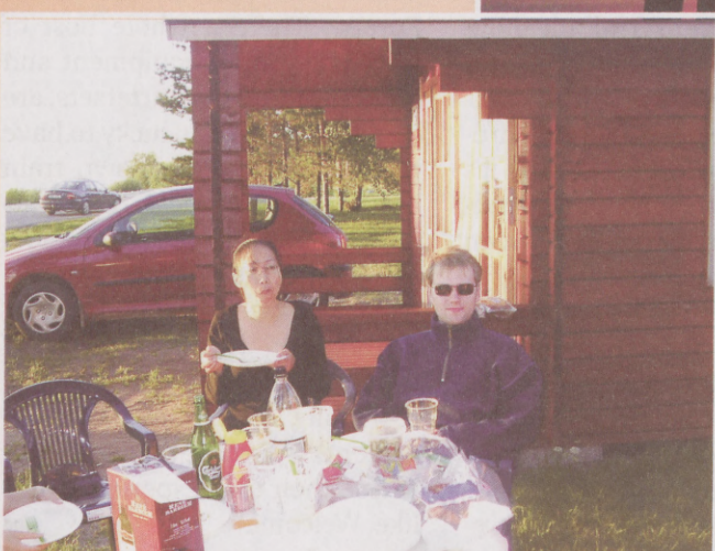
Pisut sööki ja jooki ning tuju ongi mõnus