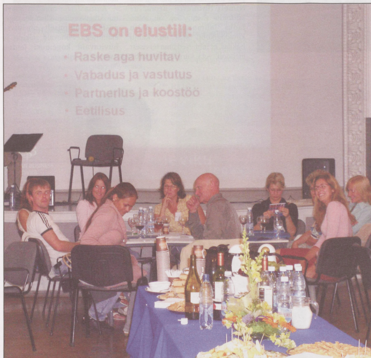
Tulevased magistrandid arutlevad koos õppejõududega magistriõppe sisu üle

õppejõududega erinevatel haridust, tudengielu ja ülikoole puudutataval teemadel. Ning fakt, et saalis tühje ei kohti olnud ja et rahvas ürituse lõppedes mõnusat vestlust kuidagi lõpetada ei tahtnud, annab tunnistust sellest, et sedalaadi teistmoodi tegemised pakuvad huvi ja lõbu nii tulevastele tudengitele kui ka nende õppejõududele.