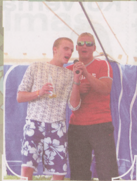
Ebsikad kogu hingega asja juures