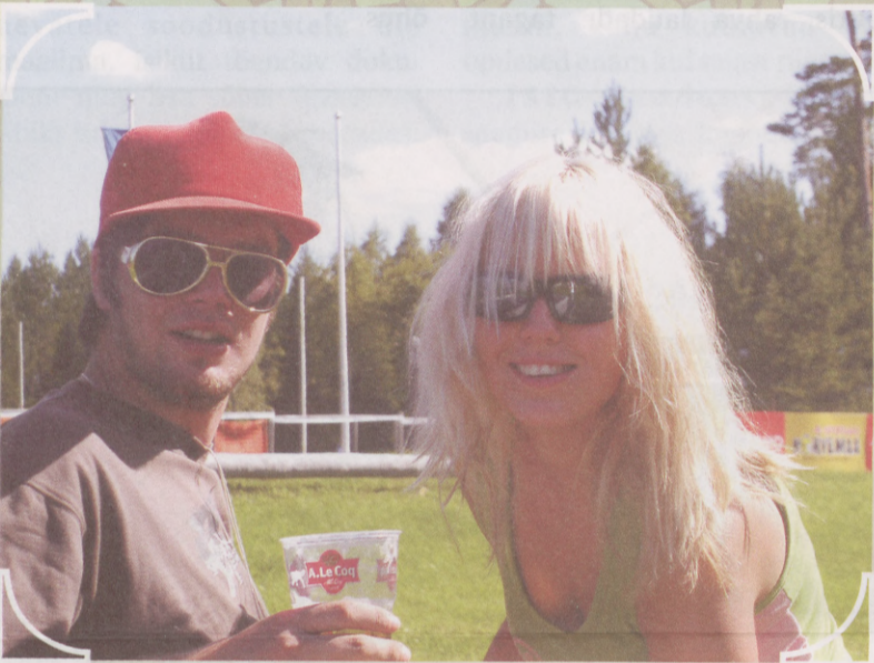
Päikeselapsed suvepäevi nautimas