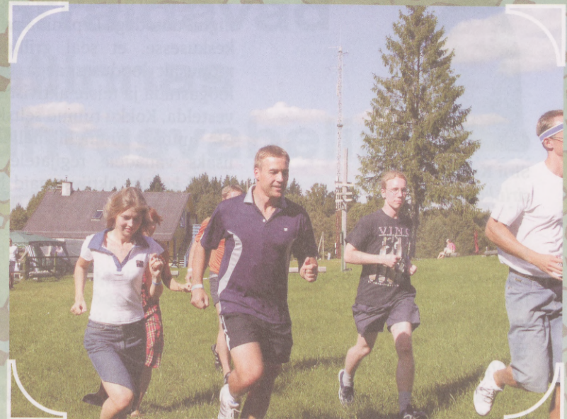
Jooksusammul võidu poole...