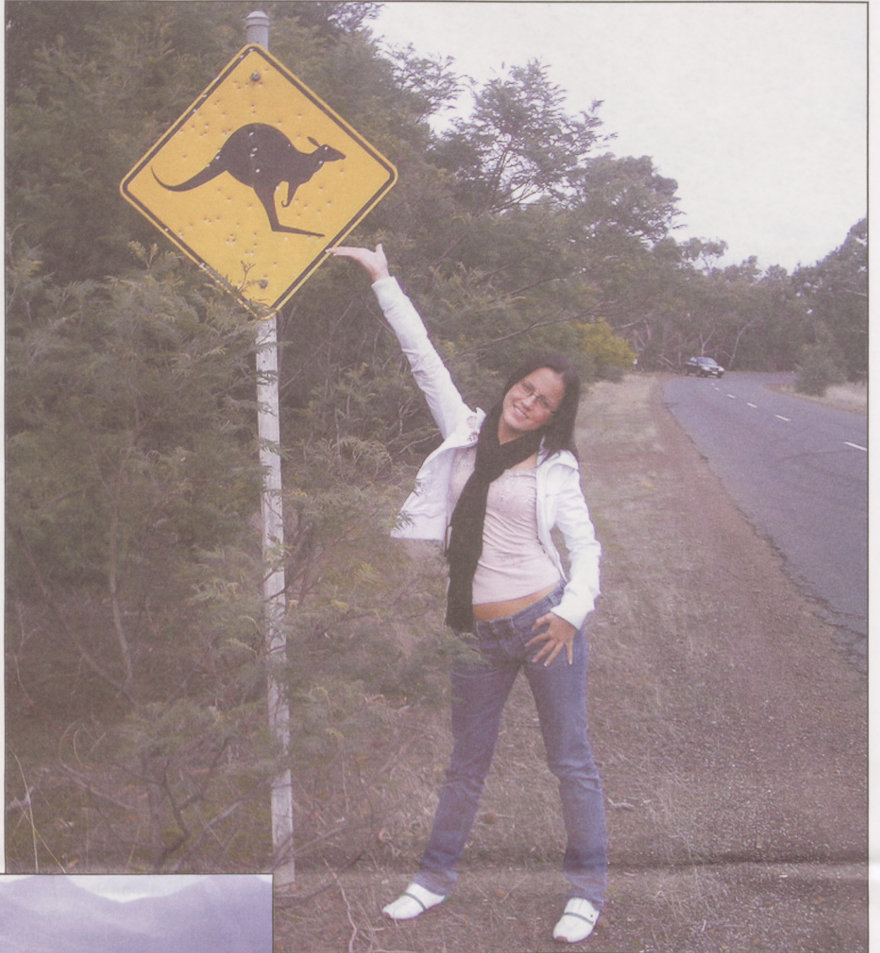
Kes keda hoiatab

Loomulikult mõjus mulle hämmastavana kohata looduses Austraalia kuulsaid loomi - kangurusid, koalasid ning mul vedas isegi niipalju, et nägin nokklooma vabas looduses endale toidupala otsimas. Nagu hiljem kuulsin, on isegi austraallastele nokklooma nägemine tõeline haruldus.