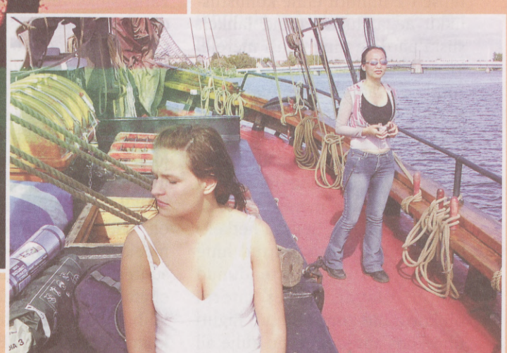
Väljasõit algas kuunar Irise sõiduga Pärnu lahele