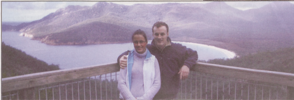
Wineglass Bay Tasmaania oma talvise võlus

Austraaliasse minekut soovitatakse kõigile reisihuvilistele, tegemist on äärmiselt positiivse elamusega. Põnevaid seiklusi ja huvitavaid kogemusi leidub Austraalias küllaga.