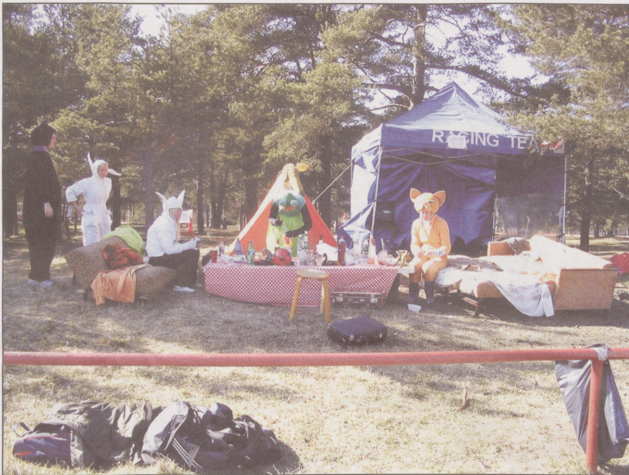
Metsloomad BESTi Stiiljalgal TTÜ staadionil

Tule ja saa see õige feeling tudengina olles, sest kui Sind ei ole kohal, siis Sa ei olegi tudeng!