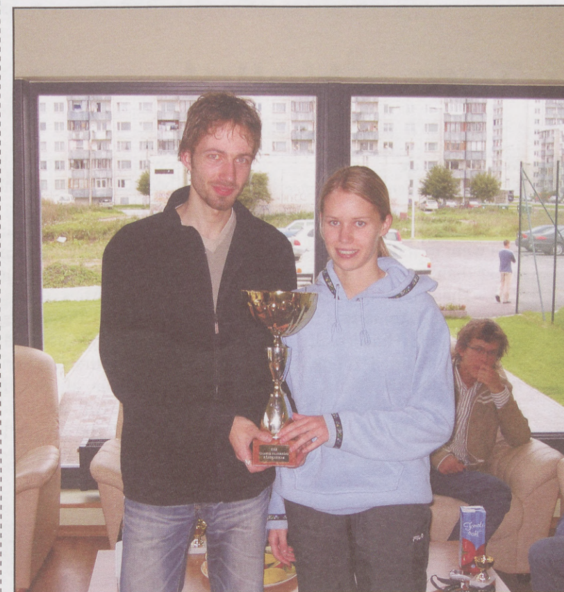
Tulge võtke nende käest ära - nüüd on teie kord võita!

Lisainfot saab küsida ka aadressil sport@ebs.ee ja numbril 5660 7439!