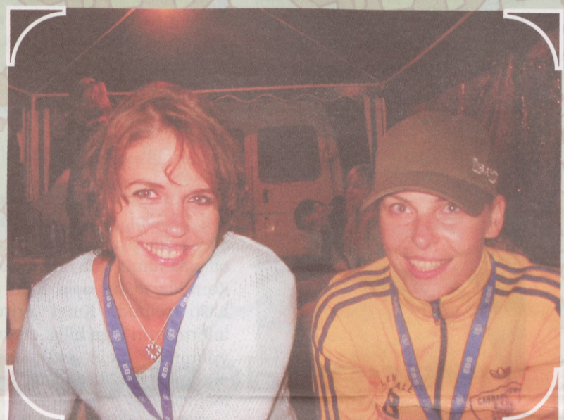
Korraldajate nägudel püsis naeratus varahommikuni