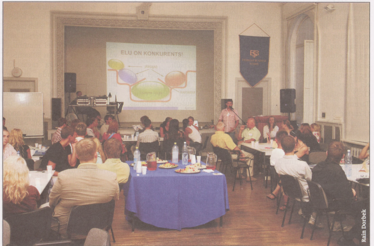
Lahtiste uste öö

Kui tavaliselt liigub teabepäevadel info ikka ainult ühes suunas – koolilt tudengile – siis nendel üritustel oli noortel unikaalne võimalus osaleda mõtetalgutel nii, et sõna said sekka öelda kõik. Arutelud, kus osalesid EBSi rektor