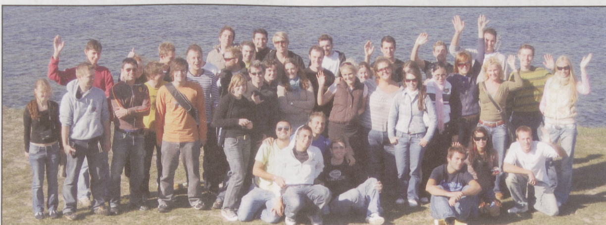
The group photo

tasty National Cuisine evening was organised, where different nationalities prepared their different cuisines. On 19 th -22 nd of October EBS Erasmus students are going to explore the lovely city of St. Petersburg. In November the visiting of Saku Brewery is planned. In December two of the Erasmus students are going to get married during the traditional International Club event – the Estonian Wedding, where international students will get to know the wedding traditions in Estonia. Close to Christmas tutors will introduce Estonian Christmas traditions on the night of Estonian Christmas. In addition to pre-planned events there are many spontaneous events organised. It promises to be a very interesting and engaging semester.