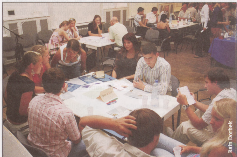
Lahtiste uste öö

Eriala ja kooli valikul peab noor inimene tegema palju otsuseid, mis eeldavad põhjalikku infokogumist ja mõttetööd. EBSil on hea meel, et noored inimesed mõistavad nende otsuste tähtsust ning on valmis õigete valikute langetamiseks oma aega ja energiat panustama. Viimast kinnitasid veenvalt meie suvised üritused. Aitäh kõigile osalejatele, nii tudengitele kui õppejõududele!