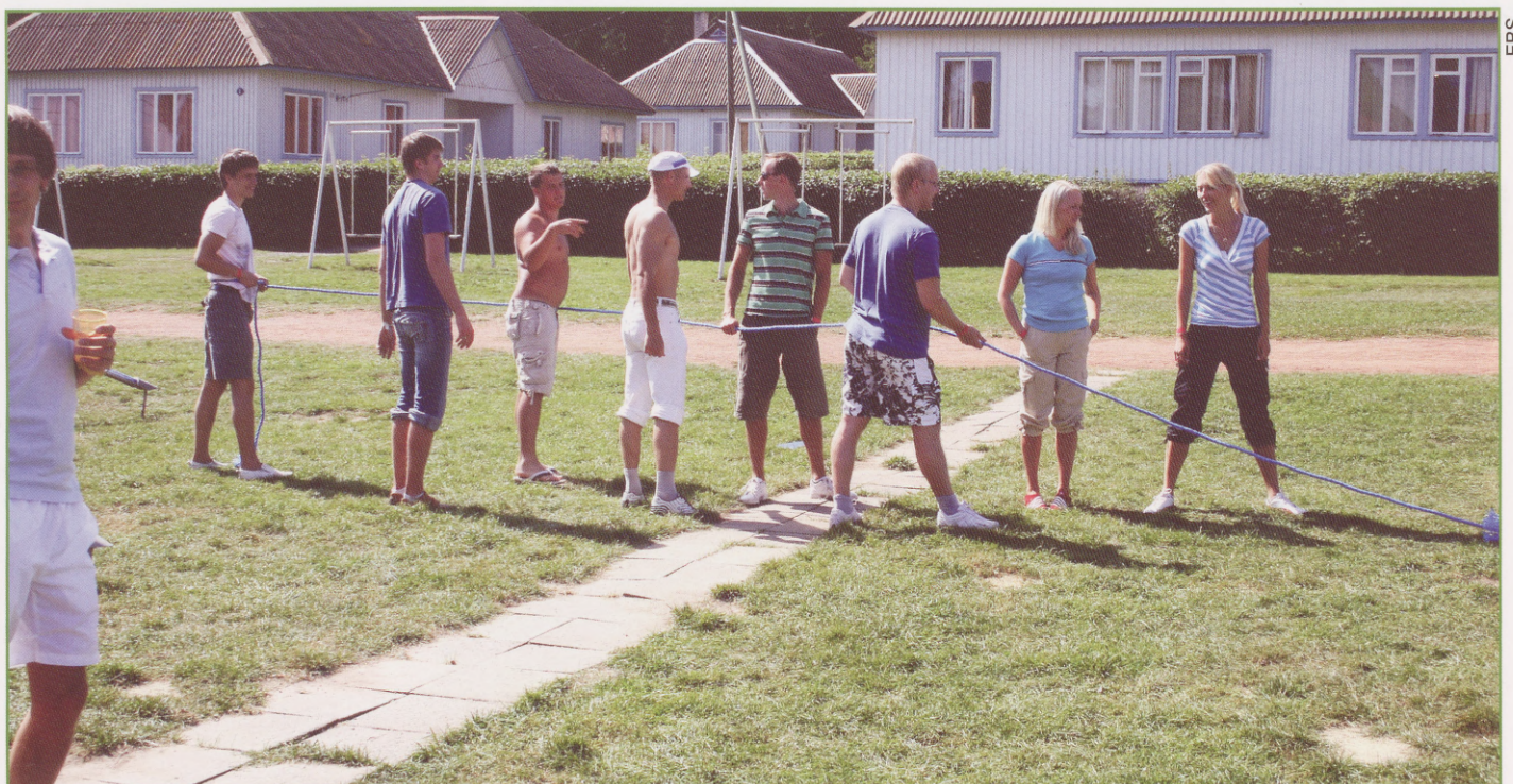
Unetuse ravil olevad ehsikad.