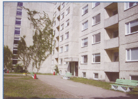
Tallinna Ülikooli Karu tänava ühiselamu.

Ka doktorantide suurem hulk pealinnas ei teeks halba. Nime „ühikas” ei pea võtma kui konkreetset tüüpilist ühiselamut. Idee tasandil on juttu pigem tänapäevasest korterelamust, kus elamistingimused on personaalsemad, kuid ei pressiks siiski rahakoti raudu väga kinni. Paljud tudengid eelistavad ühika asemel nagunii korterit üürida, kuid üüriturul