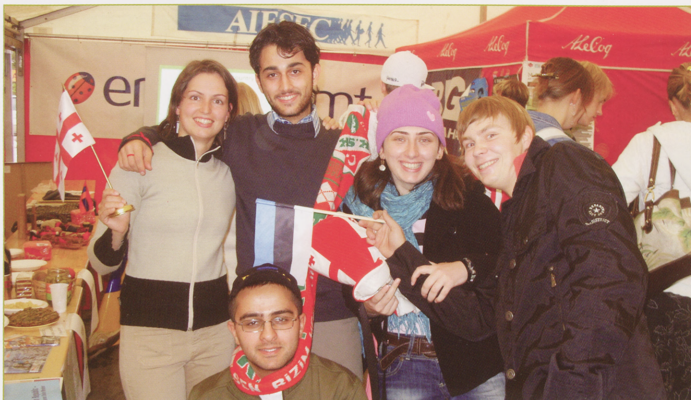
Tudengite sügispäeval 2007.

Minu AIESECi lugu on mulle andnud kuues eri meeskonnas töötamise kogemuse, väärtuslikud juhtimiskogemused, arendanud minu liidriomadusi, viinud mind tasuta Eesti tippkoolitajate koolitustele, näidanud maailma ja andnud sõpru pea igast maailma nurgast. Olen AIESECile lõpuni tänulik siit saadud sotsiaalse kapitali ehk tutvuste eest ning vaatan lootusrikkalt tulevikku, kuna alustan endiste kaas-AIESECeritega turismiäri. Olen uhke, et saan öelda: „I'm an AIESECer!”