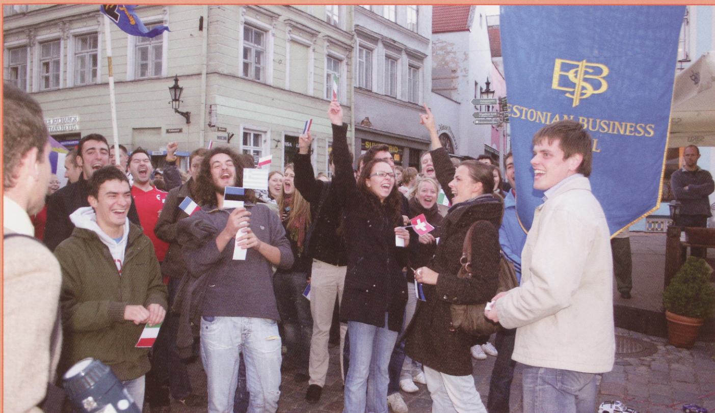
Ebsikad tudengite sügispäevadel 2007.