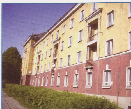
Tallinna Ülikooli Pärnu maantee ühiselamu.

Kui me räägime avalike teenuste pakkumisest, siis pigem tuleks rääkida ettevõtete käibemahtude suurendamisest ja uute võimaluste otsimisest täiendavateks rahavoogudeks. Teenuseid osutatakse ikkagi üldjuhul nišiturul, kus kedagi teist ei tegutses – parkimine, piletikontroll jne. Ometigi on