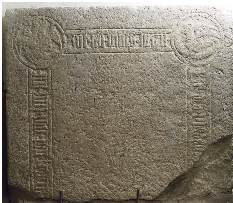
Joon 4. Hauaplaadi fragment peauksest põhja pool.

Kõige paremini säilinud poolikut hauaplaati võib näha peauksest põhja pool (joon 4). 217 Plaadist on säilinud ülemine pool. Selle nurgad on kaunistatud sõõri sees olevate evangelistide sümbolitega: vasakul tekstilindiga ingel (Püha Matteus) ja paremal tekstilindiga kotkas (Püha Johannes). Alamsaksakeelsest gooti