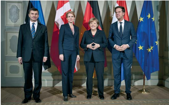
Eesti peaminister Andrus Ansip, Taani peaminister Helle Thorning-Schmidt ning Hollandi peaminister Mark Rutte Saksamaa liidukantsleri Angela Merkeli kutsel Berliinis 13. veebruaril 2012