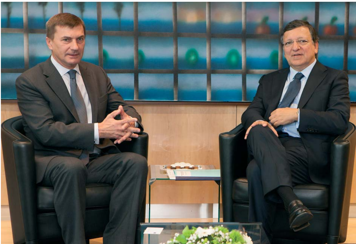
Peaminister Andrus Ansip ja Euroopa Komisjoni president José Manuel Barroso kohtumisel Brüsselis 2. oktoobril 2012

Euroopa tasandil tegutsemisel peetakse Eesti kõige olulisemateks eesmärkideks põllumajandustoetuste ühtlustamist (28%) ja Eestit muu Euroopaga ühendava infrastruktuuri nagu Rail Balticu ja Põhjamaadega energiaühenduste rajamist (26%).