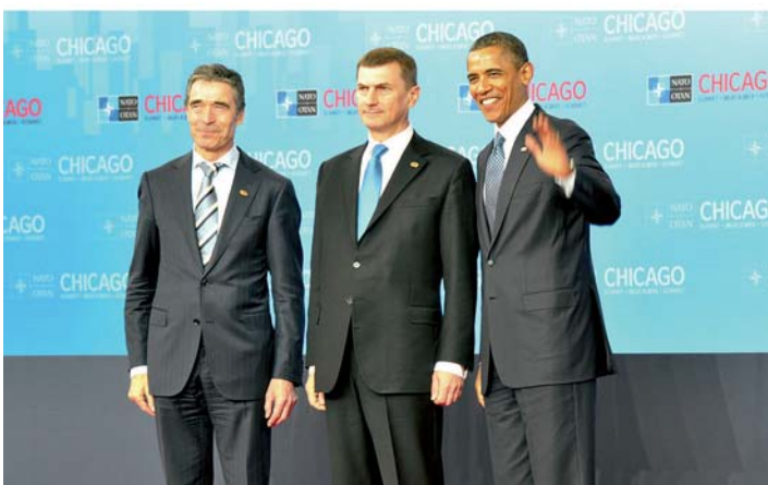
NATO peasekretär Anders Fogh Rasmussen, peaminister Andrus Ansip ning Ameerika Ühendriikide president Barack Obama NATO tippkohtumisel Chicagos 20. ja 21. mail 2012