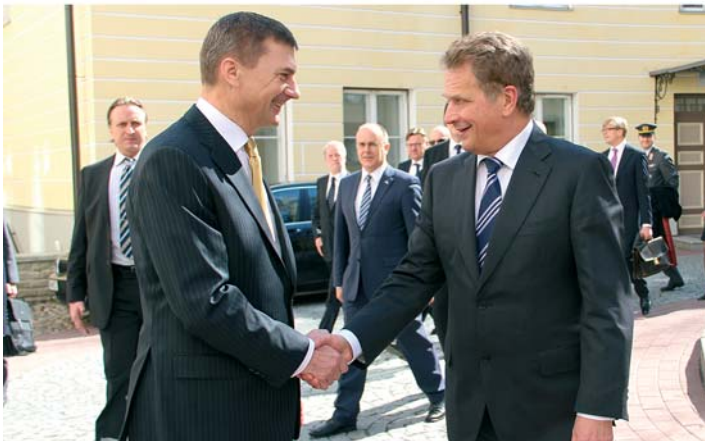
Peaminister Andrus Ansipi kohtumine Soome Vabariigi presidendi Sauli Niinistõga 25. aprillil 2012