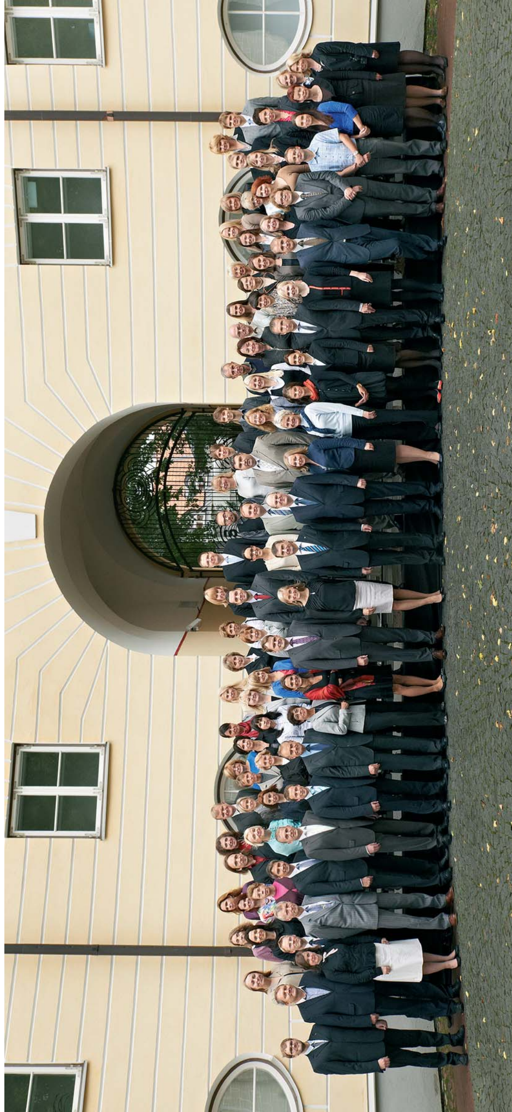
Riigikantsselet töötajad koos peaministriga Stenbocki maja hoovis 27. septembril 2012