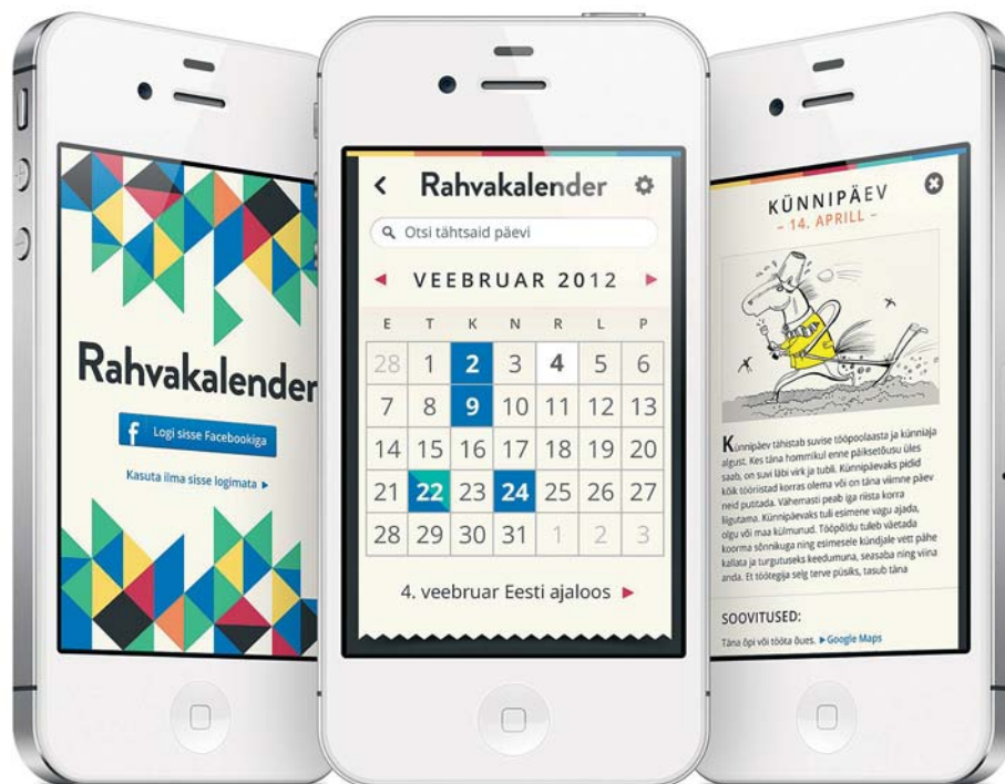
Nutitelefoni rakendus „Rahvakalender“

15. novembri istungil moodustas valitsus Eesti Vabariigi 100. aastapäeva tähistamise ettevalmistamiseks valitsuskomisjoni, kuhu kaasatakse aastapäeva tähistamisega enam seotud ministrid, riigisekretär ja Vabariigi Presidendi esindaja. Peaministri juhitava komisjoni ülesanne on tagada Eesti Vabariigi 100. aastapäeva väärikas ja meeldejääv tähistamine.