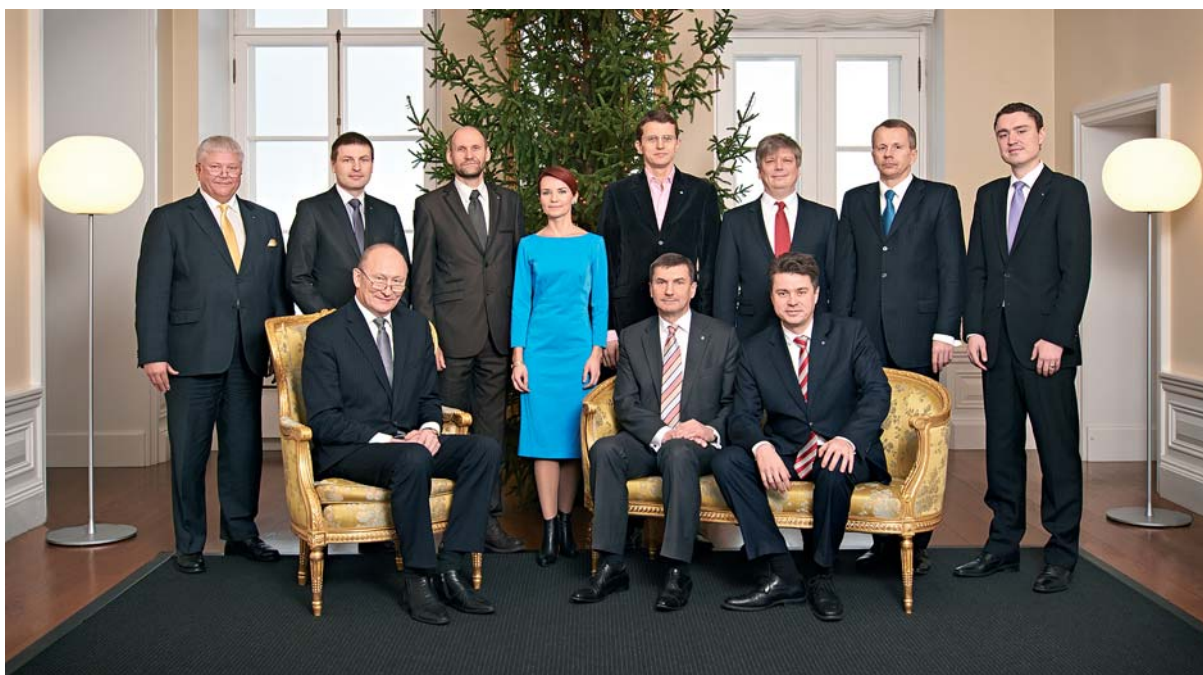
Vabariigi Valitsus Stenbocki maja Riigivanemate saalis 20. detsembril 2012