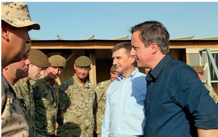
Peaminister Andrus Ansip ja Suurbritannia peaminister David Cameron külastamas Eesti kaitsevälalasi Helmandi provintsis Afganistanis 18. juulil 2012