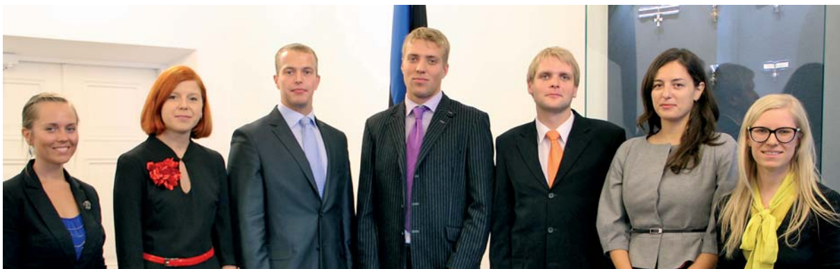
Juhtimistalentide programmi aväiritus Stenbocki majas 4. septembril 2012

2012 oli ka edukate avalike konkursside aasta. Üheksast konkursist kaheksa töid teenistusse uue tippjuhi, keskmine kandidaatide arv ühele ametikohale kasvas kahe inimese võrra.