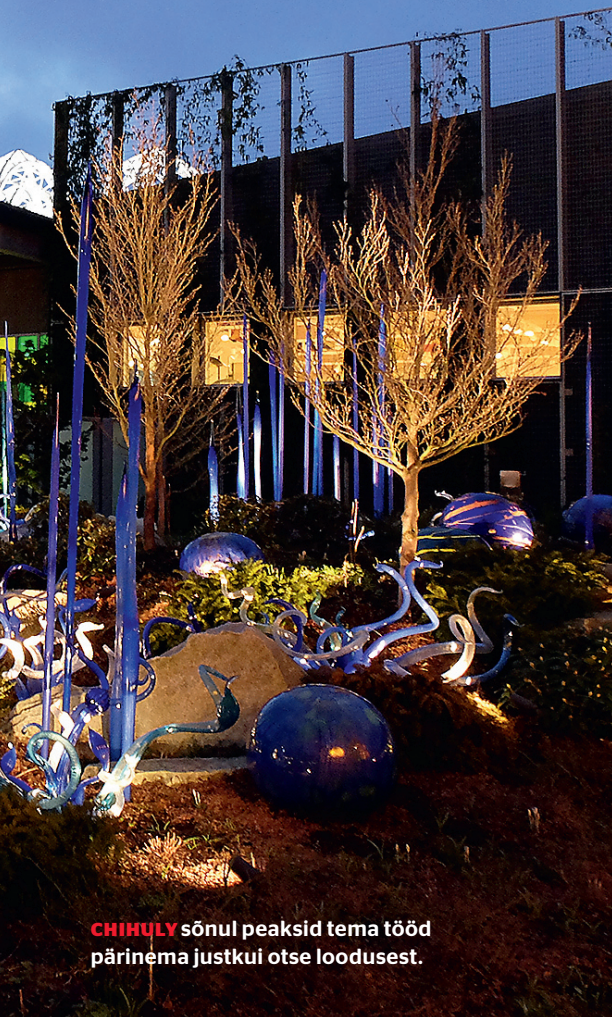
CHIHULY sõnul peaksid tema tööd pärinema justkui otse loodusest.

“Kui vähegi on tegu monumentaalse teosega, võib see vabalt olla ju ka klaasist,” ütles Lobjakas “Klaas on eksklusiiv-