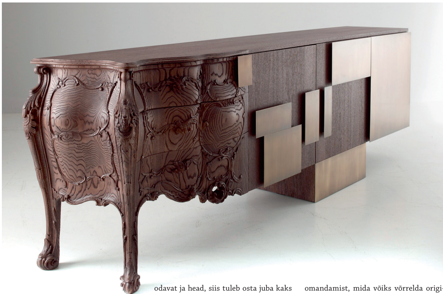
Atelieris on müügil tootja Emmemobili kummut "Evolution", mille hind on 17 000 eurot.

odavat ja head, siis tuleb osta juba kaks asja," on Atelieri tegevjuht veendunud. Disaintooteid pärandatakse põlvest põlve, see tähendab juba tõelise väärtuse