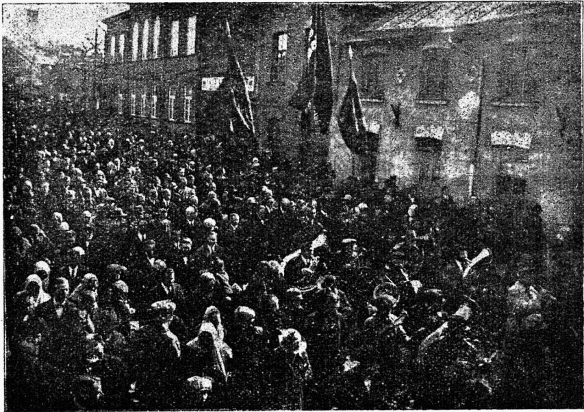
1. mai rongikäik Tallinnas 1923 a.