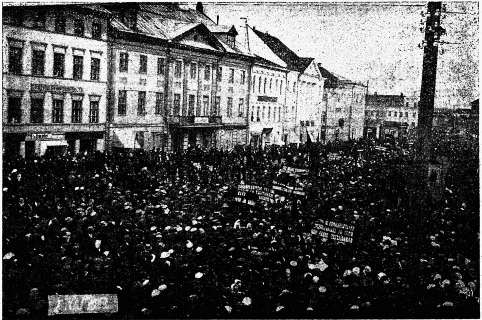
1. mai rongikäik Tartus 1923 a.