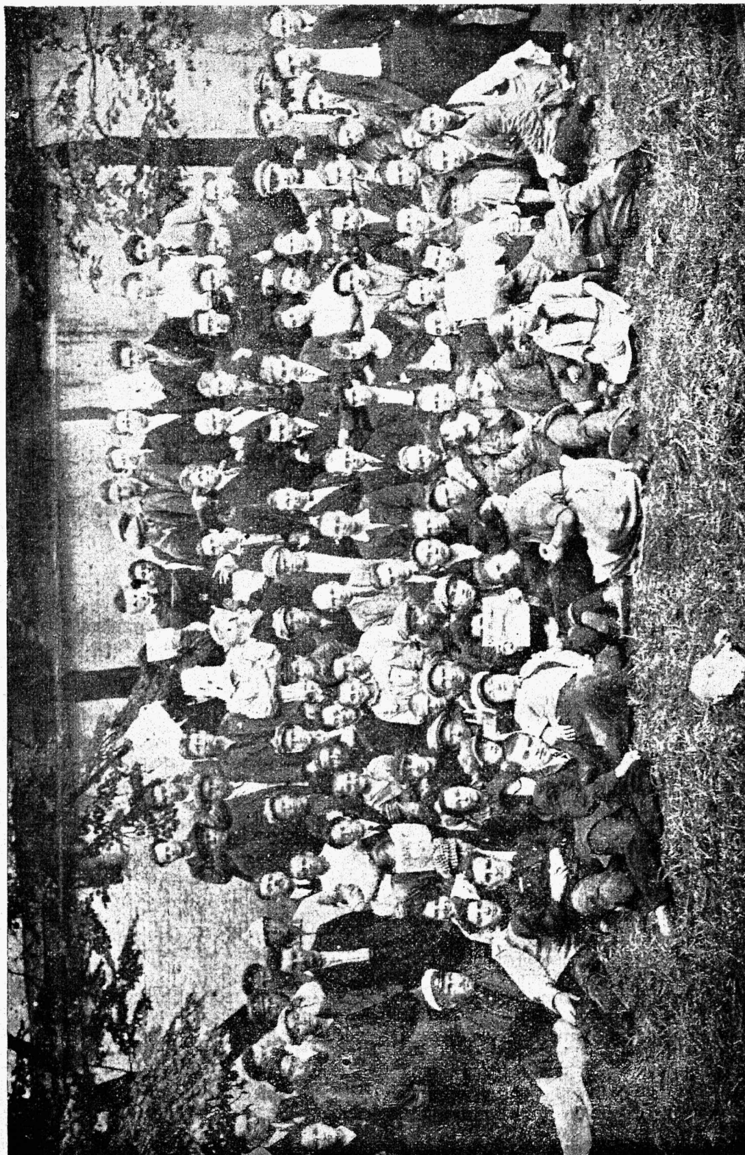
Kommunistliku Noorsoo Internatsionaali 4. kongressi saadikud