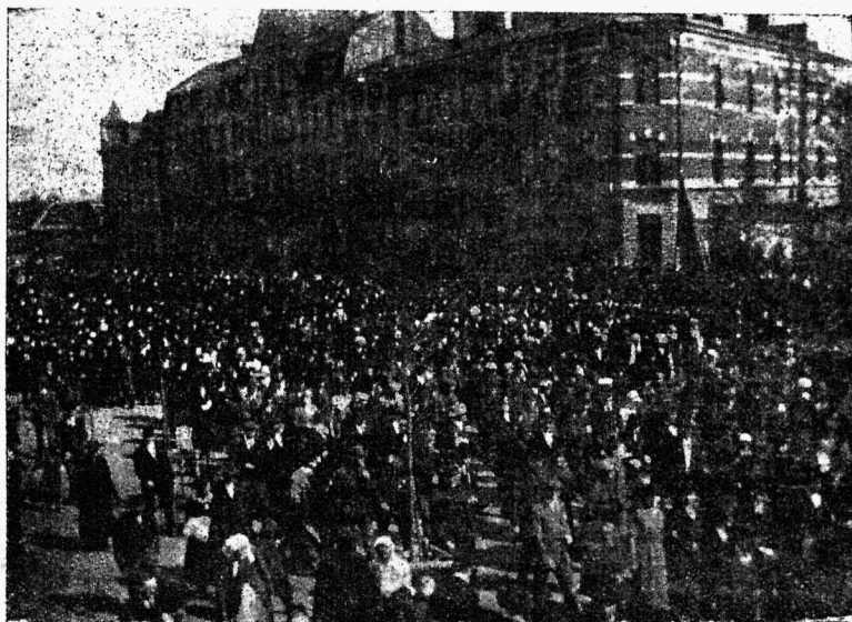
1. mai meeleawaldus 1921. a. Tallinnas.

*) Selleks peaksid küll nende eneste hugast wõrsunud inimsuse jutlustajad mõjuma!