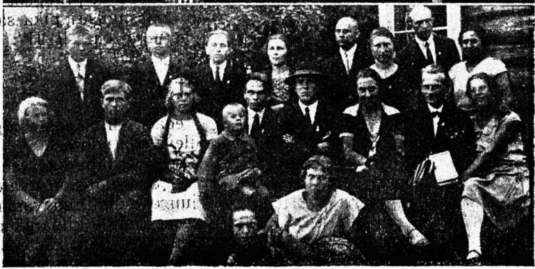
Esimesi ülesvõtteid ÜENU Laekannu noorsoolasist.

olevatest pahedest. Sõnumi kirjutaja leiab, et liig suur alkoholi tarvitamine olla tingitud halvast eeskujust.