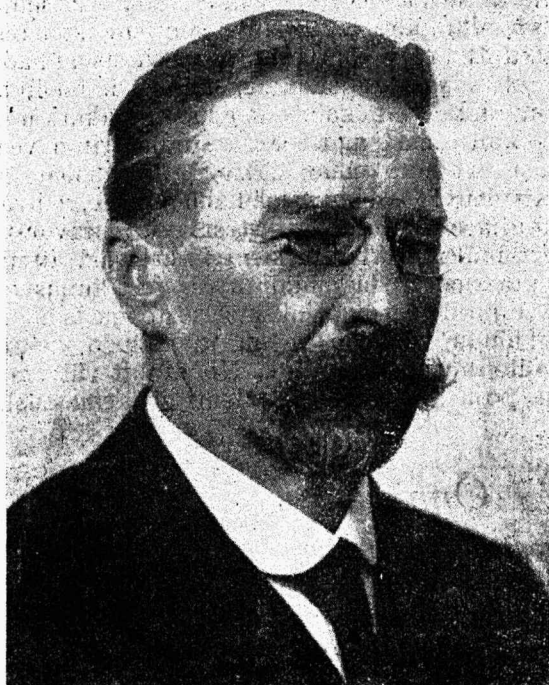
August Kitzberg. 9. I. 1856 — 10. X. 1927.

Päevad lenda- vad, aastad möö- duvad kui une- näos... Aegade keeris viib enda- ga igavikku inim- hingi. Üksteise järel nopib ta nad elu tööväl- juilt. Kõiki neid leinavad sõbrad, olgu neid enam või vähem. Au- gust Kitzbergi leinab aga terve Eesti. Sest Au- gust Kitzberg ar- mastas oma rah- vast. Omas kir- jas „Noor-Ees- tile ja noortele“ (29. dets. 1915. aastal) kinnitab ta: „Oma rahva- le tahtsin ma mi- dagi anda, oma südant.“ Selle kingi eest oleme talle suure tänu võlgu. Ta memu-