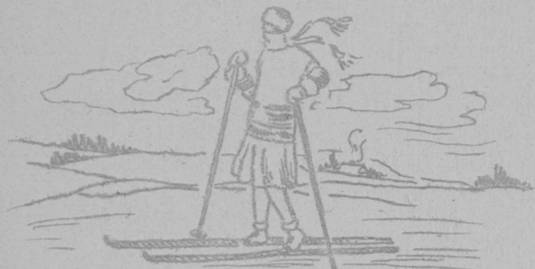
Suusatan üle välja.

Suusatan üle välja, kus aastate eest olen vilja nütnud, ja sürdun metsa.