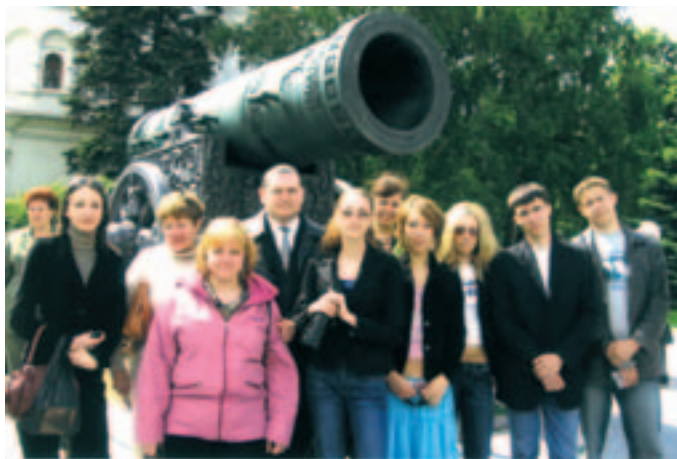
Tallinna Vene Kultuuri Pühapäevakooli õpilased Tsaar- suurtüki juures.

Moskva tuntuim paik on aga kahtlemata Kreml oma arvukate katedraalide ja muuseumidega. Neist üks vanemaid nii Moskvas kui ka Venemaal üldse on Relvapatat, kus hoitakse unikaalset kallivara kollektsiooni. Kremli territooriumil asuvad ka kuulsad Tsaar-suurtükk ja Tsaar-kell.