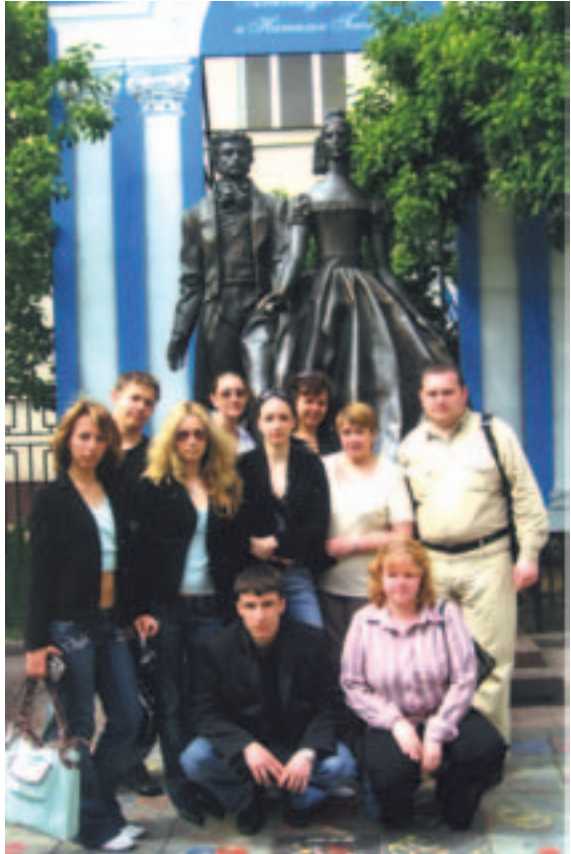
Tallinna Vene Kultuuri Pühapäevakooli õpilased ekskursioonil Moskvas.

juba Vene tänavale. XVII–XVIII sajandil moodustus vene asunduste kett Peipsi järve kirde- ja läänekaldal. Sellesse kuulusid Sõrenets (Vasknarva), Logozõ (Lohusuu), Tšornõi (Mustvee), Krasnõje gorõ (Kallaste), Nos (Nina), Kolki (Kolkja), Voronja (Varnja) ja teisedki paigad. Pepsi-äärsed alad said elupaigaks vene vanausulistele, kes põgenesid sinna XVII sajandil pärast patriarh Nikoni kirikureforme. XIX sajandil asus linnadesse elama vähesel määral vene kaupmehi ja käsitöölisi, seal seadsid end sisse vene sõjaväelased. Derpti ( Jurjevi , Tartu) ülikoolis aga õppis arvukalt vene üliõpilasi. XIX sajandi lõpuks suurenes vene elanikkond Eestis veidi ametnike, sõjaväeteenistujate, õpetajate, üliõpilaste ja ülikooli professorite arvel. Samuti saabus siia kvalifitseeritud töölisi, kes hakkasid ehitama sadamaid, raudteid, tehaseid. Iseseisvas Eestis mõjutasid venelaste arvu bolševistlikult Venemaalt lahkunud vene emigrandid ja põgenikud, samuti inimesed, kes