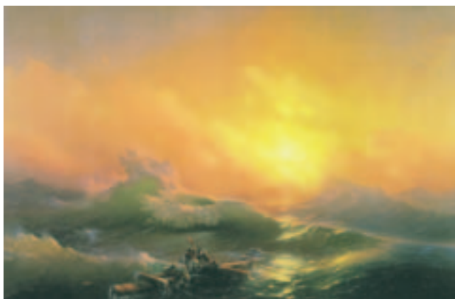
Ivan Aivazovski maal „Üheksas laine“.

Ivan Aivazovskile (1817–1900) töid kuulsuse maalid, mis kujutasid mere stiihiat, jõudu ja võimsust. Aivazovski tuntuim töö on „Üheksas laine“. Looduse stiihiale vastukaaluks kujutas kunstnik nende inimeste mehisust, kes laevahukus suutsid end päästa. Aastail 1844–1845 kujundas Aivazovski Balti mere äärseid kindluslinnu: olgu siinkohal näiteks Kroonlinn ja Tallinn.