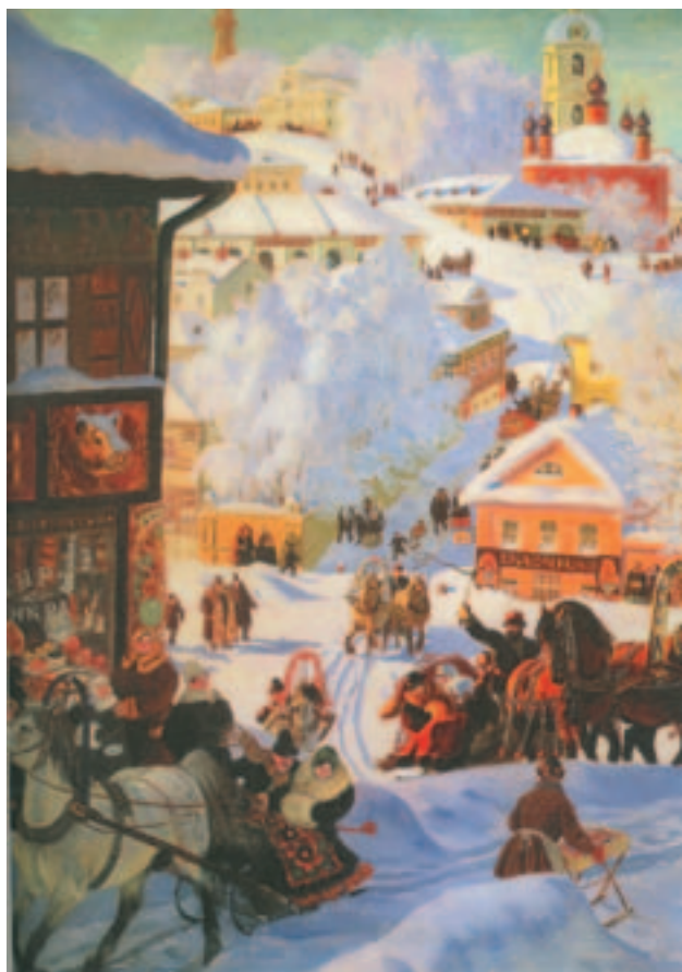
Boriss Kustodijevi maal „Vastlad“

Kolmapäeval kutsusid ämmad oma väimehed pliine sööma.