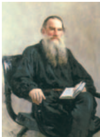
Foto 10 Lev Tolstoj portree (autor Ilja Repin).