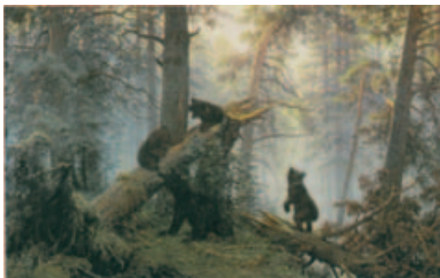
Ivan Šiškini maal „Hommik männimetsas“.

Ivan Šiškini (1832–1898) meelisteemaks oli vene looduse ilu. Kunstniku tuntuimaks tööks kujunes „Hommik männimetsas“, mis meisterlikult kujutab looduse ärkamist. Hommikune udu pole veel hajunud, päikesekiired alles alustavad oma teed, tungides vaevaliselt läbi metsa, kus langenud männitüve juures askeldab karuema oma poegadelega (karud on maalinud Konstantin Savitski). XIX sajandi 80. aastatel ja 90. aastate esimesel poolel viibis Šiškin sageli Narva-Jõesuus. Kunstnik on loonud rea teoseid, kujutades reaalselt eksisteerivat maastikku, mida võib praegugi näha Soome lahe kaldal Sillamäe ja Narva-Jõesuu vahel. Need on sellised maalid nagu