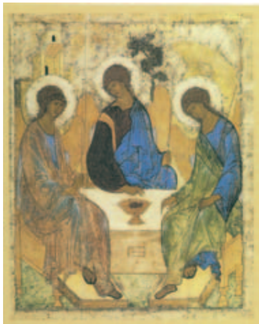
Andrei Rubljovi „Kolmainsus“.

Karl Brüllovi (1799–1852) peateos on maal „Pompei viimne päev“. Esimest korda sai vene kunstis maali sisuks mitte üksik- isiku kangelastegu, vaid hoopis rahva traagiline saatus. Pärast sellele maalile osaks saanud tohutut menu pühendus Brüllov täielikult portree- kunstile. Valmisid tuntud kultuuriinimeste Vassili Žukovski, Aleksei Tolstoi, Ivan Krõlovi portree.