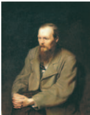
Fjodor Dostojevski portree (autor Vassili Perov).

päästab maailma.“ Fjodor Dostojevskile on püstitatud mälestusmärk ka Tallinnas – Vene Kultuurikeskuse kõrvale.