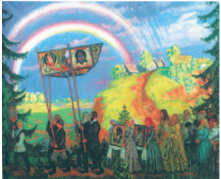
Boriss Kustodijevi maal „Ristikäik lihavõtte ajal“.

Nagu teame, on paljud lihavõtete seotud traditsioonid säilinud tänaseni.