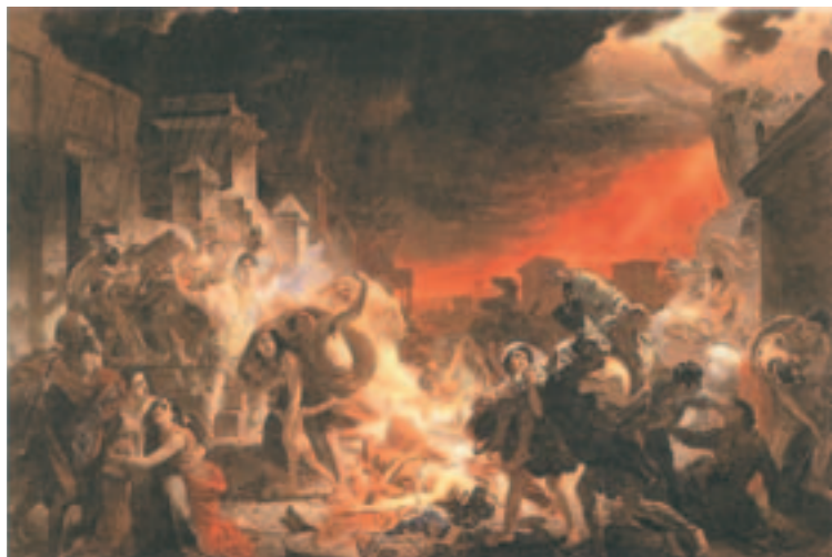
Karl Brüllovi „Pompei viimne päev“.