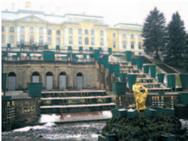
Petrodvorets oma kaunite pursk- kaevudega.

mastega rikkalikult liigendatud hoone, kus võib leida üle 1000 ruumi. Palee kujutab endast suure siseõuega suletud nelinurka.