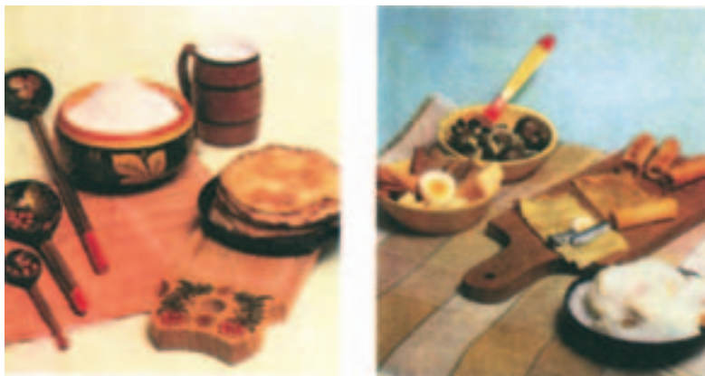
Mõned hõrgutised vene peolaualt (vastlad, pasha – viimane A. Plistoni natüürmort).

Küpsetistest on läbi aegade eriti populaarsed olnud mitmesuguse täidisega pirukad: liha-, marja-, seene-, kartuli-, kala-, köögivilja- või kohupiima-