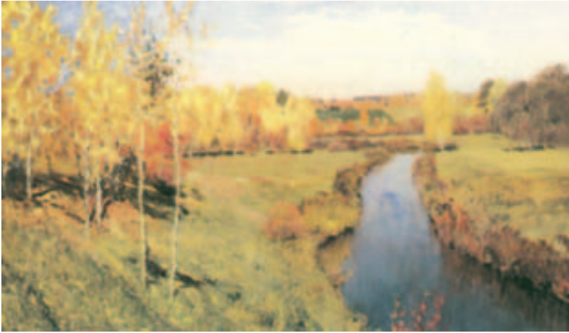
Kuldne sügis (Issaak Levitani maal)

maale, stepp Lõuna-Volga aladele, Uurali äärmistele lõunaaladele ja Ida-Siberi mõnele osale. Pinnas on neis paigus väga viljakas ja niisiis laiuvad peaaegu kõikjal põllud.