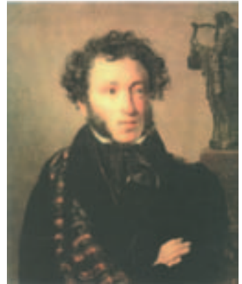
Aleksandr Puškini portree (autor Orest Kiprenski).

Üle maailma on kuulsad Fjodor Dostojevski (1821–1881) romaanid „Kuritöö ja karistus“ ning „Vennad Karamazovid“. Dostojevski tundis sügavalt kaasa oma paljude teoste kangelase, alandatud ja solvatud „väikese inimese“ ebaõnnestumistele. Elu mõtet nägi kirjanik usus ja Jumalas ning armastuses inimese vastu. Just Dostojevskile kuulub tuntud ütlus: „Ilu