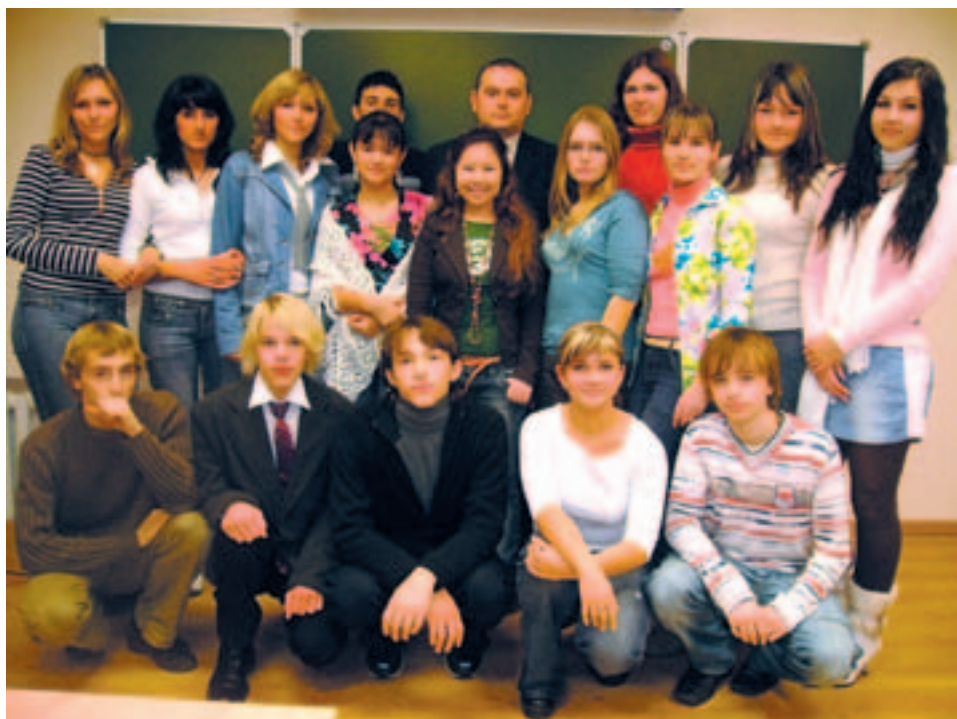
Tallinna Vene Kultuuri Pühapäevakooli praegused õpilased.

elasid Petserimaal ja Narva-tagustel aladel (vastavalt Tartu rahulepingule, mis liitis kõnealused territooriumid Eestiga). Pärast Eesti Vabariigi sõltumata taastamist 1991. aastal võime kõnelda venelastest kui arvukaimast rahvusvähemusest Eestis.