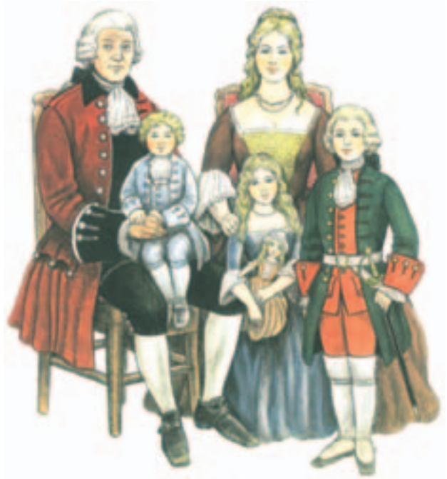
Niisuguseid rahvarõivaid kanti Katariina II ajal.

tuse poolest. Põhiline erinevus oli see, et põhjapiirkondade naised kandsid enamasti pihtseelikut, lõuna pool eelistati vaipseelikut. Naiste igapäevarõivaste hulka kuulusid seelikule lisaks särk, põll, rinnaesine põlleke. Naiste särk oli meeste omaga sarnaselt avara lõike ja pikkade varrukatega. Valge särgi rinnaesine, õlapealsed, alläär ja varrukasuud olid kaunistatud punase tikandiga. Kusjuures põhjapiirkondade naiste särgi alläär oli ornamendiga kaunistatud hoopis rikkalikumalt kui lõunapiirkondade naiste oma. Kõige rikkalikumalt oli mõlema piirkonna naistel ilustatud põll. Linasest riidest valgeid särke ja põllesid kandsid põhjapoolsed naised niisiis pihtseelikuga. Lõuna pool kanti – nagu öeldud – rohkem vaipseelikut: villasest kangast valmistatud ning võösse töödeldud rõivaeset, millel mõnikord oli linasest riidest vooder. Jalas kanti nahast poolsaapaid, aga ka nõõridega pastlaid.