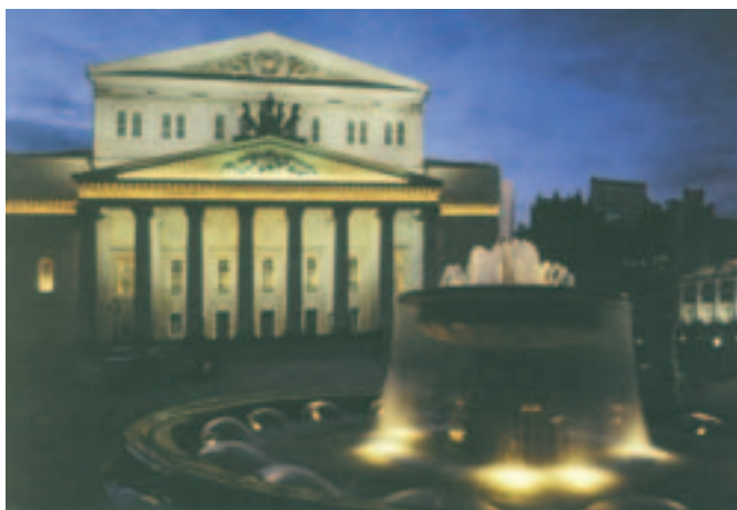
Moskva Suur Teater.

Endiselt populaarsed on ooper ja ballett (45 akadeemilisest teatrist 15 on ooperi- ja balletiteatrid). Üle maailma on endiselt kuulsad Suur Teater ja Maria Teater. Viimastel aastatel on tuntuks saanud Moskva „Helikon“, „Uus ooper“, Kammerteater Boriss Pokrovski juhtimisel. Vene teatrikunsti oskab hinnata ka eesti vaataja ning viimasel ajal on tal külalissetenduste vahendusel olnud võimalus teha seda isegi kodus Tallinnas.