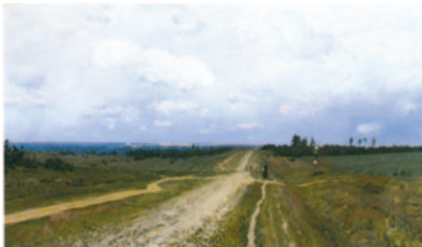
Vladimirka (Issaak Levitani maal).

Siberis asub ainulaadne Baikali järv – maailma sügavaim mageveejärv. Baikalisse suubub 336 jõge, ent väljub vaid üks – Angara.