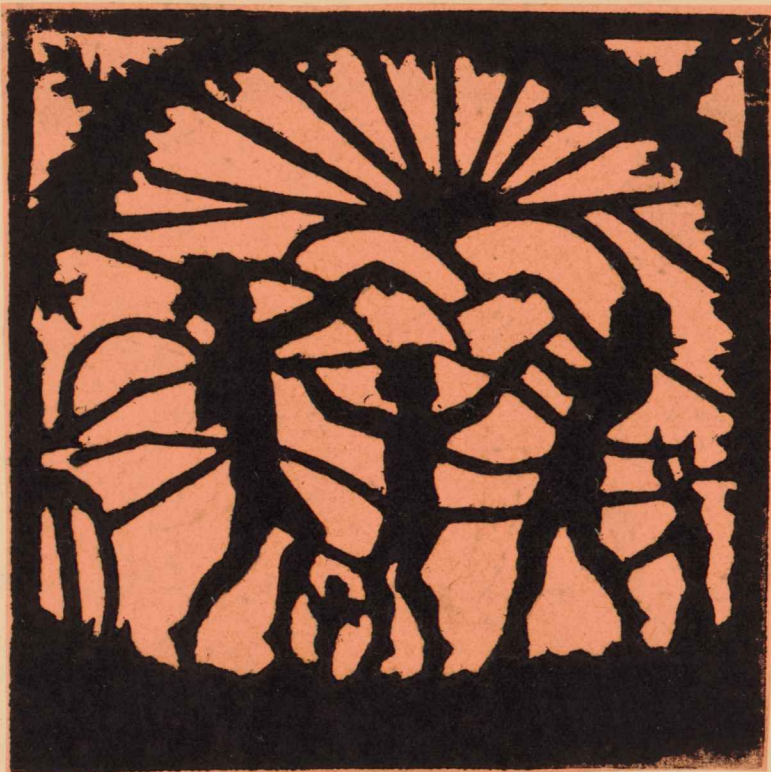
Paberšabloonkoopia - A.Post, VI kl.