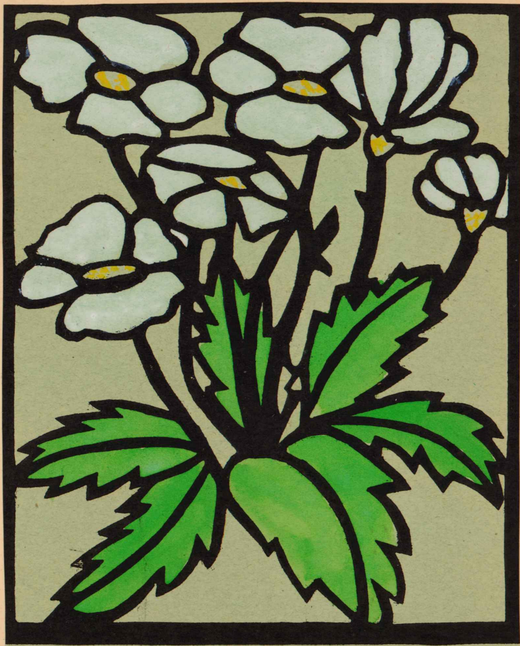
Anemoonid (paberšabloontrükk) - R.Lepik, VI kl.