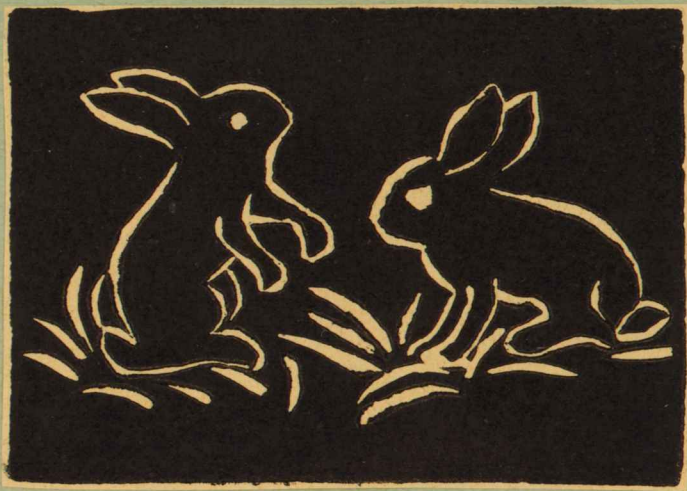
Jänesed (linoleumlõige) - E.Pall, IV kl.