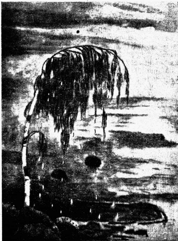
A. Promet. Pisarad.

Praegusel silmapilgul tulevad mulle elavalt meele tühe vanema põlve mehe sõnad