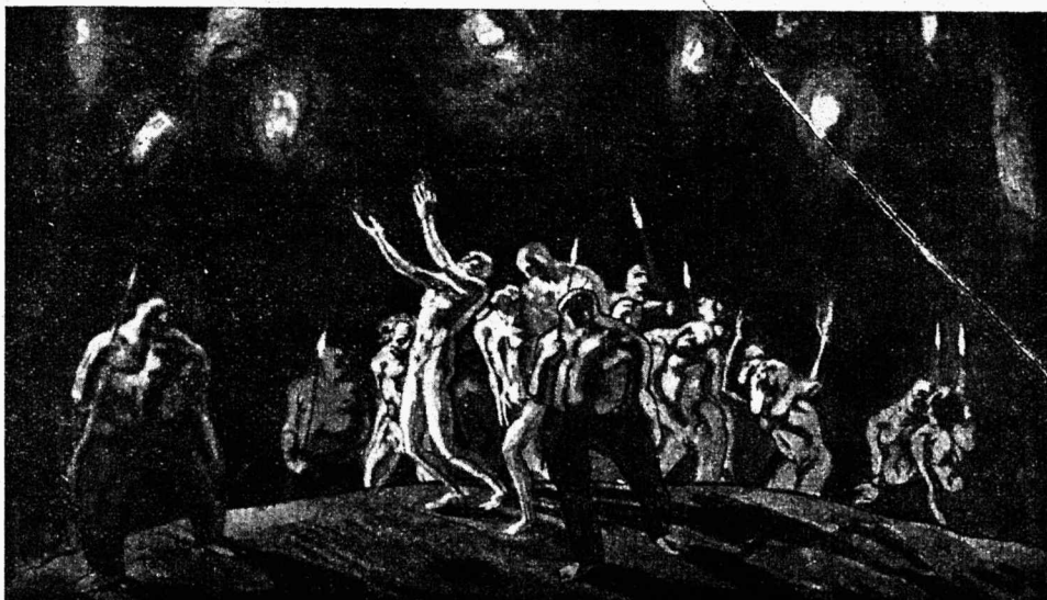
N. Triik: Orjad mäsu eel.

Kõik see ei või edespidi nii kesta. Sei- sukord peab muutuma! Ei või jätkuda vaim- liste huvide puudus, vaimutöö ja selle too- dete ignoreerimine ning materialismi võidu- kääk idealismi vastu. Kaugele, kaugele tu- leks kihutada jämedalt isiklikud ja õigluse- tult kitsarinnalised parteihuvid ja nende ala- tine silmas pidamine. Kui meie seda ei