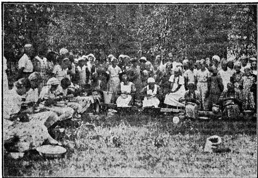
Kartulikooremise võistlused Soomes maanoorte suvipäeval.

Külastades Soomet, nägin maanoorte agarat tööd lääne- ja põhjamaa viljari-kastel põldudel, kuid pikemat aega viibi-sin kaljurohkes, järvederikkas Savus, mis asub Kuopio ümbruses. Savu järvede vesi on sügav-sinine, kaljuse ranna oee-gelpilt selge ja karge. Palju on kaalutud kive ja juuritud metsa, millega loodud põldu, kuid sagedasti haritakse veel eri-lise kaheharulise harksahaga ja libista-takse kamaräkkega kividevahelist põllu-pinda, kust hiljem sirbiga lõigates kogu-takse hoolega iga viljakörs.