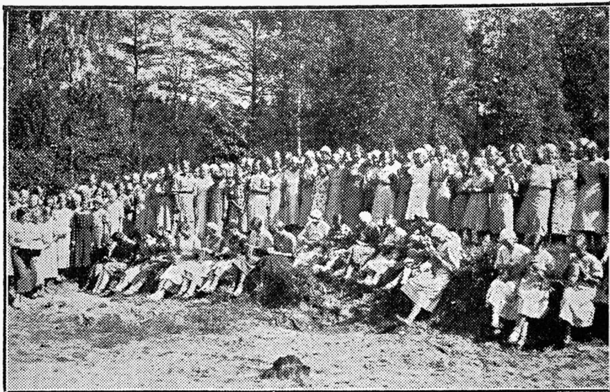
Nõelumisvõistlused maanoorte suvipäeval Soomes.

suunaga. Tundub, et maanoored peale tegeliku tööskuse, võtavad ringitööst kaasa vaimliselt ja hingeliselt kasvatavaid väärtusi.