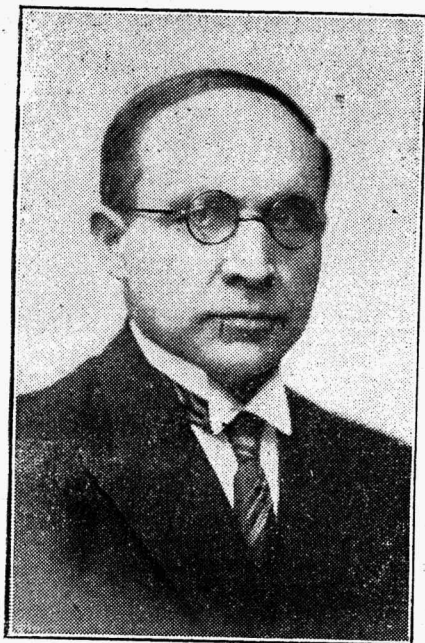
Peaminister prof. Jüri Üluots sai 50 aastaseks 13. jaanuaril 1940.

Ajaloo pöördpunktidel on ikka olnud vaimsed jõud, mis viimati on leidnud lahenduse sellele, mis elu nõudis.