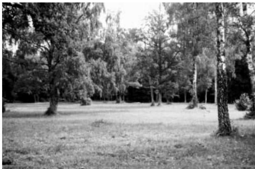
Mäepea puisniit Saaremaal

Puisniit kui kooslus on väga vana. Arvatakse, et puisniiduilmeline maastik tekkis Eesti aladel koos esimeste inimasualadega. Puisniidu võisid meie esivanemad kujundada metsast, seda pikkamööda harvendades, võsa