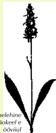
kahelehine kääkeel e ööviil