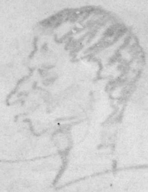
1. Oina II