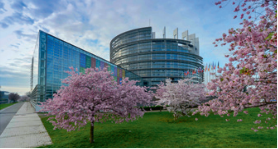
© European Union 2014. Source: EP Louise WEISS building: © Architecture Studio