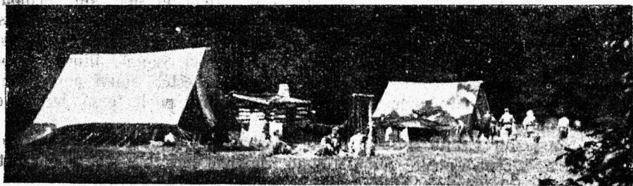
Gillwell Park'i juhtide laagri väli.

Nüüd asub laagrijuhit Teie salkadesse määramisele. Esimene on järgmisel päeval salga päälilik, siis saab teine selle ameti, jne. kuni kõik läbi, olles igaüks ühe päeva. Laagrijuhit näitab Teile nüüd kogu laagrit omas ulatuses. Teedelgi on nimetused, päätee „Chiefs' approach“ (B. P. tee). Ka metsaaltar on olemas. Laagrivälja ise asub põliste puude vahel suurel avaral