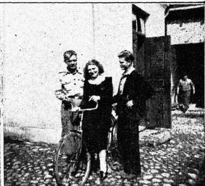
1) Matkaja Jääger ühes Läti skautidega. 2) Tundmatu sõduri haua Varssavis. 3) Grodnos Poola skautvend oma õega. Ööbisime nende juures.

skautrühma kodus, milline on momendil Läti parim. Öhtul vaatasime linna tähtsamaid kohti ja kuulasime pargi muusikat ning südames oli mingit rahutut kärsitust. Tahtsime ruttu edasi ja seda ka saime. 23-dal olime juba Plaivinos, kus ööbisime saksa skautide perekonnas, ning kolm päeva hiljem läbi raskuste ja vihma jõudsime Ida-Läti suuremasse keskusse — Daugavpils.