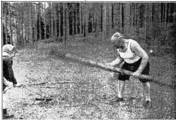
Sakala maleva papi Moks telgi vaia „maha löömas“ . . .

miks on juutide küsimus, keda asub siin üle 3 miljoni. Nende arv on viimasel ajal suurenenud Saksast välja rännanute arvel. Juudid püsivad siin kõik vaestena, sest poolakas ei lase oma nahka nii kergesti üle kõrvade tõmmata, kui mõni teine rahvas. Otse vastupidi, — tundub, et poolakas on suurem ärimees kui juut.