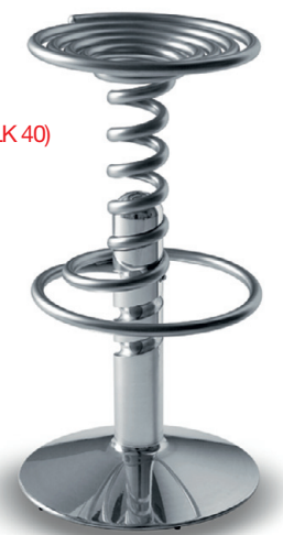
TABURETT SCREW (LK 40) 20 000 KROONI DRIADE