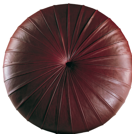
ISTE ESEDRA (LK 47) 23 400 KROONI POLTRONA FRAU