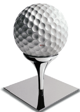
TABURETT SIEDI-TEE (LK 46) HINDA KÜSI TOOTJALT GUFRAM