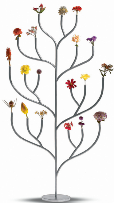
LILLEVAAS HANAHANA (LK 45) 15 800 KROONI DRIADE