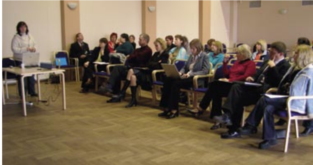
Karksi ümarlaud 11.04