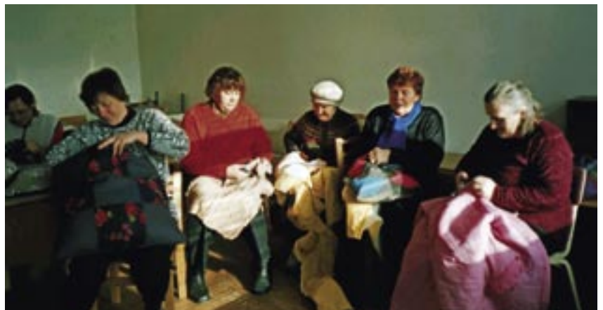
Kasutatud riideid töötlemas.