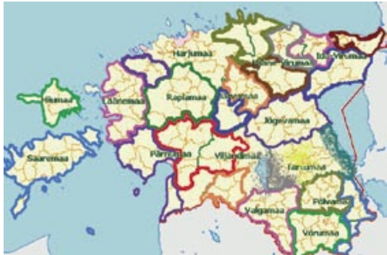
Aluskaart Maa-Ameti koduleheküljelt www.maaamet.ee

Hetkel on kavandatud tegevusgruppide arvu tõusnud 24 -ni, mis katavad pea kogu Eestit. Kolm tegevusgruppi ühte maakonda on tekkimas: Lääne-Virumaal, Ida-Virumaal ja Tartumaal. Tegevusgrupid on muutumas, nii muutuvad ka juhatuse ja liikmete arvandid. Karksis, II Leader- ümarlaval keskendusime tõsisemalt asutatud tegevusgruppidele - ankeeterisime ja saime järgmise pildi: