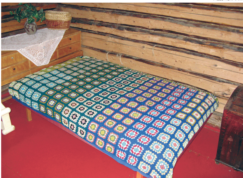
Palju pisikesi heegeldatud motiive annavad kokku suure kireva voodikatte.