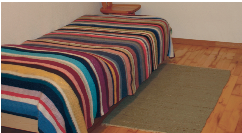
Triibuline voodikate on kootud ripskoes, kasutades erinevaid värvitoone.