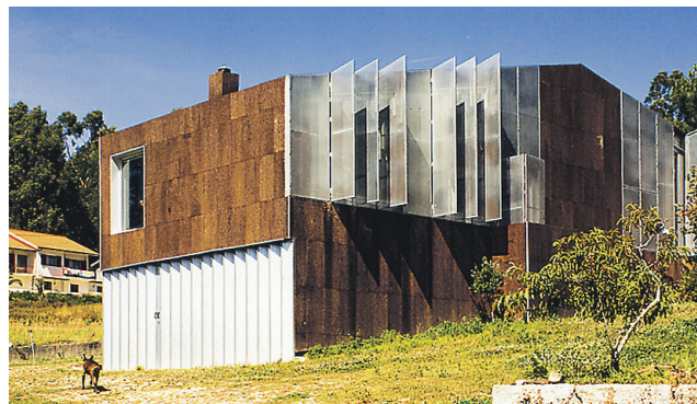
► Korgipuust maja nagu iidne karumõmm. Arhitektuuribüroo Arquitectos Anónimos, 2008