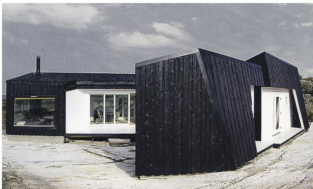
► Kõikepidi kiivas kaljusuvila. Arhitektuuribüroo Fantastic Norway, 2008