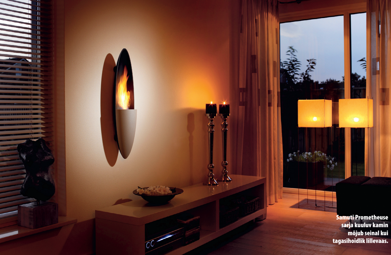
Samuti Prometheuse sarja kuuluv kamin mõjub seinal kui tagasihoidlik lillevaas.

“Ma ei ütle, et tegu on tuleasemetega, vaid hoopis tuleruumidega. Eks suuremad etanoolil põlevad kaminad annavad ka soojust, aga pisemad formaadid on mõeldud muidugi lihtsalt kodu elavdamiseks. Tahma neist ei tule, nii et just linnas on nendega väga kerge,” kinnitab korstnapühkija.