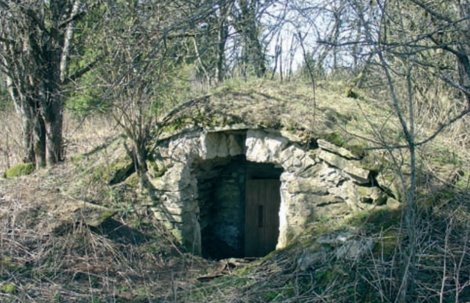
Suurempien maatilojen luona sijainneet kivikellarit näyttävät tuonakaisen rakennustaiteen taso – kaariholveja osattiin rakentaa melkein jokaisessa kylässä. (TN)