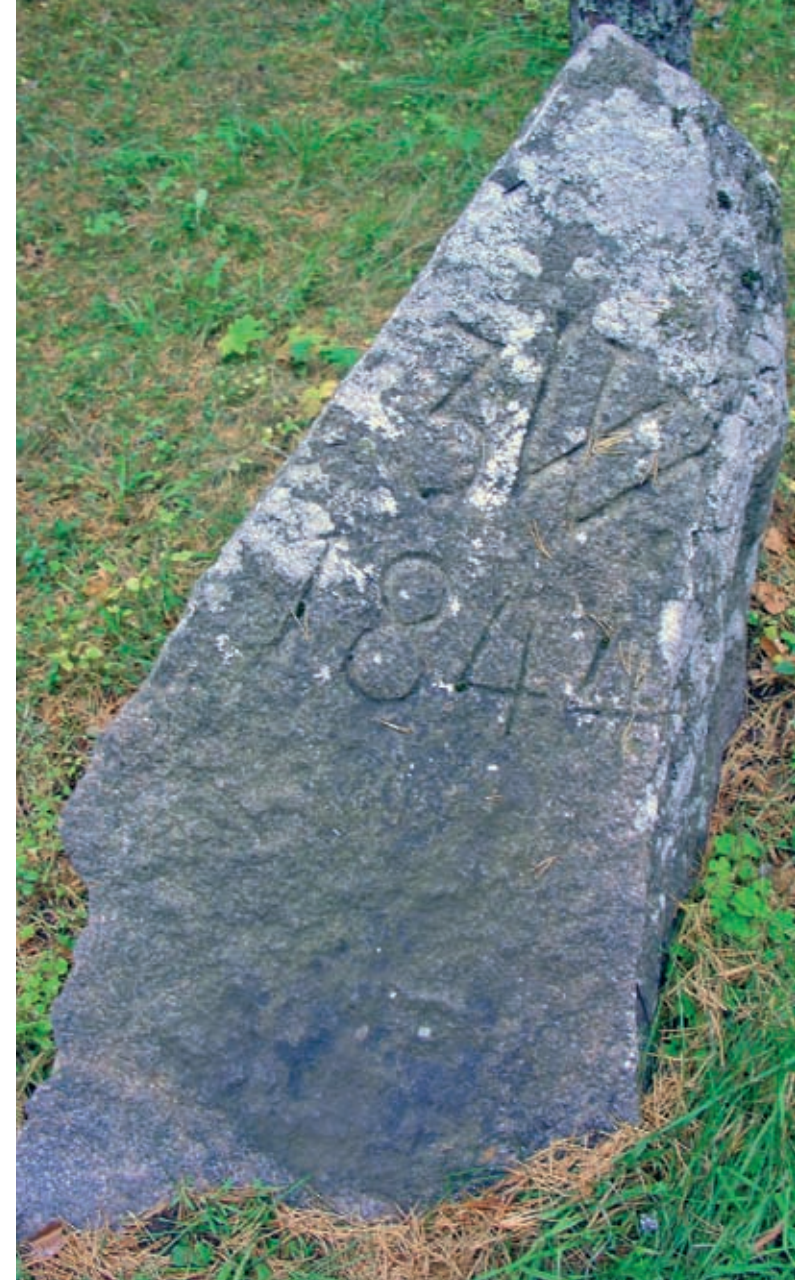
Historiallisien maanteiden viereiset virstakivet ovat pienuutensa takia olleet kaksikertaisessa vaarassa, ne ovat tuhoutuneet tielaajennuksien takia sekä vaeltaneet yksityiskerääjien kokoelmiin hyvän saavutettavuuden takia. (TN)

Haudat Pölkkytiet Hautaviitat Pako- ja piilopaikat Hiidenlähteet, hoitolähteet Kaupat Hiidet, hiidenpuut, perinnepuut Majatalot Kappelimäet Palokunnan vajat Kellotapulit Kantakyläen paikat Keinut, keinumäet Aarnioppuut Ruttokylän sijat Perintöryhmät Kiviset ylityspaikat Perintökivet, uhri- ja palvonta- kivet Kivisillat ja –rumpu Seurantalot Kokoelmat Ristimäet Koulurakennukset Ristipuut Kahlauspaikat Seuratalot Palvontarakennukset Suosillat Kapakat Talvitiet Kylän laidut Köyhäinkodit Markkinapaikat Kunnantalot Kolkutuslaudat Vanhat kappelirauniot Kunnan viljamakasiinit Vanhat paikannimet Manttelisavupiiput Yhteis- ja hätäaputöissä peruste- tut kohteet Mukulakivitiet Muonamiesten talot