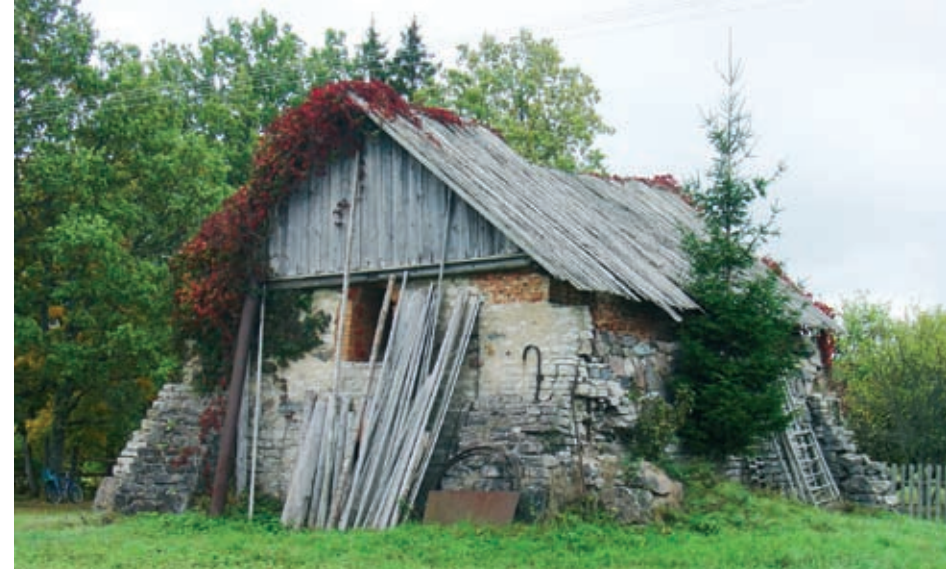
Maan rikkauksista pidettiin arvossa tiiliuuneissa savia. Maalaisiännän 1930-luvulla rakentama tuotantorakennus osoittaa yritteliäisyyttä ja riskirohkeutta. (TN)