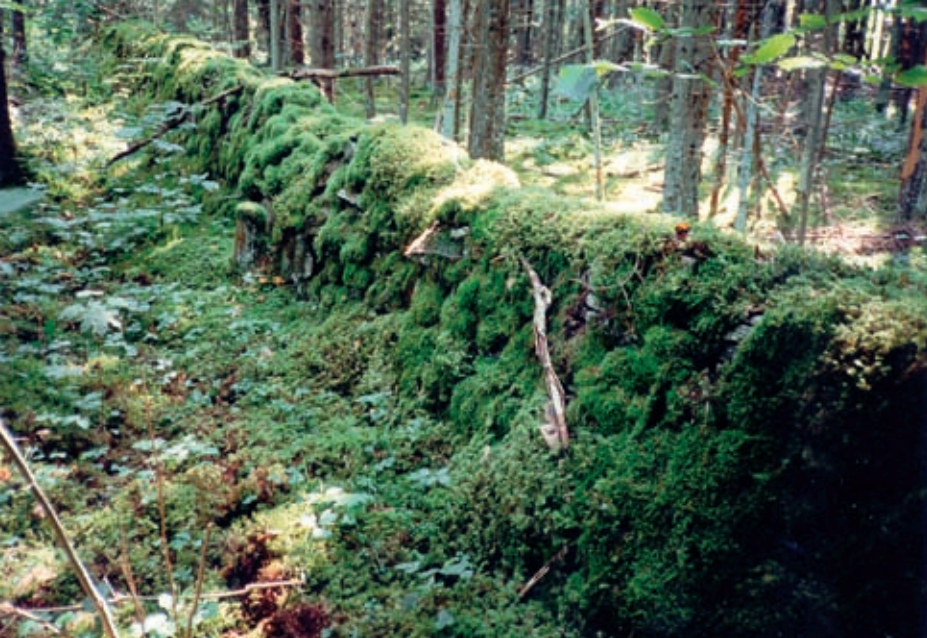
Metsissä löytyy kilometrien pituisia kiviaitoja, joiden käyttötavoite on tähän asti epäselvää. Silti ne ansaitsevat säilyttämisen. (LT)

Metsätaloudellisista vaikutuksista kulttuuriperintöön epäilemättä olennaisimpia ovat hakkuja seuraavat suorat ja epäsuorat vaikutukset. Entä yksipuolisen lähestymisen välttämiseen tulisi kosketa myös metsäsukupolven perustamiseen seuraaviin aspekteihin. Nämä eivät ole vähämerkityksellisiä, koska silloin päätetään, paljonko tilaa kulttuuriperinnölle annetaan metsässä. Kun olemme kulttuuriperinnön hakkuulla vapauttanut metsästä, ei olisi järkevää peittää sitä seuraavana taas puumaton alle. Siten olisi järkevää jättää kulttuuriperinnön kohde sopivalla puskurimaapalalla metsänviljelyn alueen ulkopuolelle eikä istuttaa sinne puita uuden metsäsukupolven perustamiseen. Mikäli ympäröivässä nuorennoksessa joskus tulee aika valaisuhakkuun, samalla tulee huolletuksi myös kulttuuriperintö, antaen sille valoa ja ilmaa.