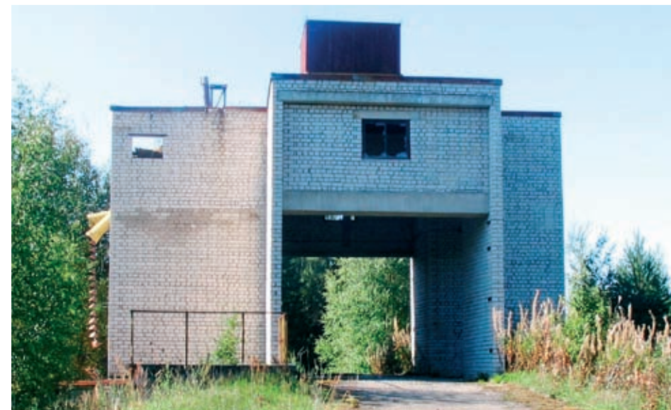
Neuvostoliiton aikaa merkitsevät tuhannet sodallisten tavoitteiden noudattamiseen ja maataloudelliseen suurtuotantoon liittyvät kohteet. Nämä ovat lähistoriaa ja niiden arvossa pito on kysyttävää, koska niihin sisältyy runsaasti kielteistä Viroa varten. Silti ne ovat osaa kulttuuriamme ja useiden esimerkkien säilyttäminen on tärkeää. (AM)