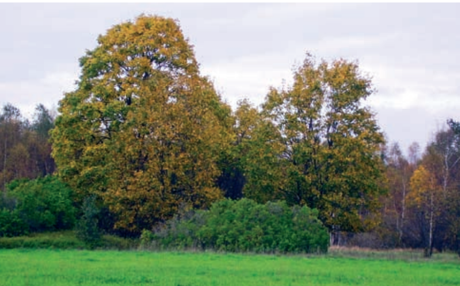
Maatilan rakennuksien sijainteja paljastavat kiharalatuaiset puut sekä ilmastonoloihimme vastaavat koristepensaat. (AH)