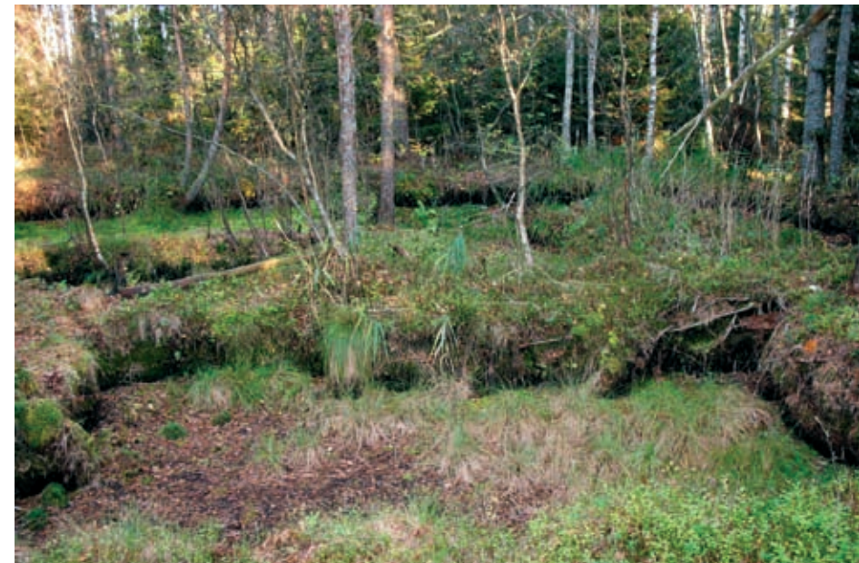
Kosteikot muodostavat yli 5 prosenttia Viron kokonaispinta-alasta ja turpeen tuotanto on ollut tärkeä jo yli vuosisadan. Käsini kaivattuja turveojia kuvaavat selväpiirteiset kontuurit. Kulttuuriperinnön kohteisiin osoittaa-kin luontomaisemaan kuulumattomien asioiden esiintyminen.