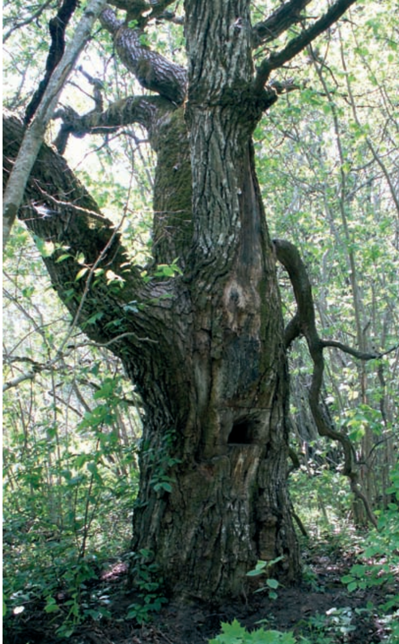
Mehiläispönttönä käytetty aarniopuu on myös kulttuuriperinnön osa. Sen paremman näytteille asettamista ja elinvoiman säilyttämistä varten puun ympäristö tulisi puhdistaa viidakosta. Yleistapauksessa puukasvien poistamisella kulttuuriperinnön kohteesta ja ympäristöstä on myönteinen vaikutus. (JK)

esiintymisellä tiet pitäisi suunnitella samansuuntaisesti näiden kanssa. Mikäli henkilöllä on välttämätön tarve ylittää kiviaitaa metsäkohteilla, tähän täytyy käyttää yksittäisiä varmoja paikkoja ja aita täytyy varmistaa oksanpatjalla molemmalta puolelta. Kohteen rikkomisen ja hakkuujätteillä roskaamisen välttämiseen puut tulisi kaataa kohteen sijainnin vastasuuntaan. Mikäli puiden kuljetukseen täytyy käyttää vanhoja metsäteitä, työt pitäisi suunnitella talvikaudeksi.